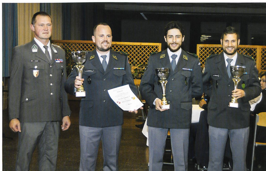
Premiazione Team ASSU Lugano 4