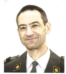
col SMG Stefan Holenstein

Dal punto di vista della politica militare e di sicurezza, il 2017 si preannuncia un anno complesso. Nel primo trimestre del 2017 la Società Svizzera degli Ufficiali (SSU) si trova ad affrontare una serie di sfide importanti che riguardano, in particolare, l'attuazione dell'ulteriore sviluppo dell'esercito (USEs) e i relativi progetti.