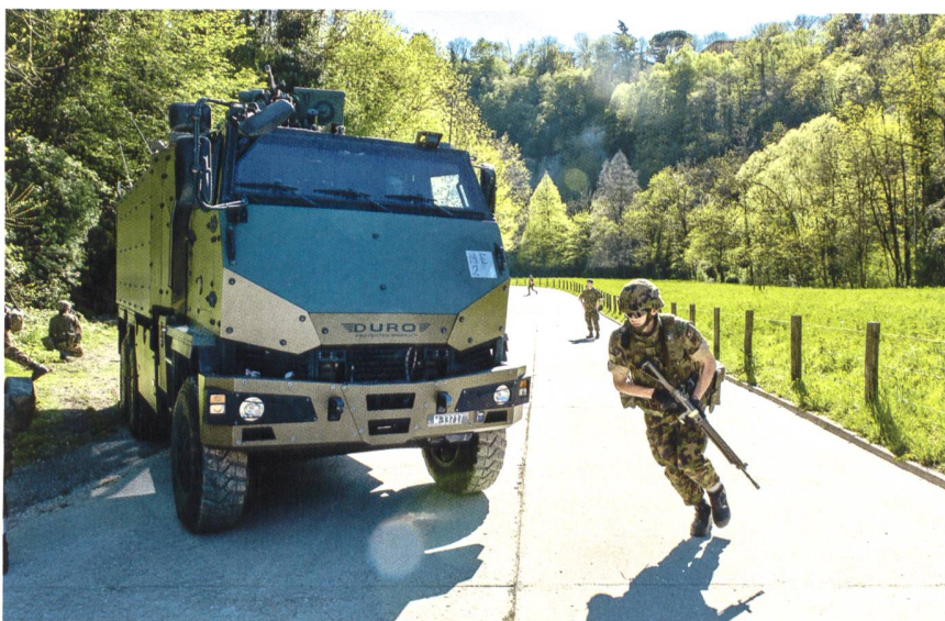
Alcuni esponenti dei Volpodinghi alle prese con i militi del bat fant mont 30