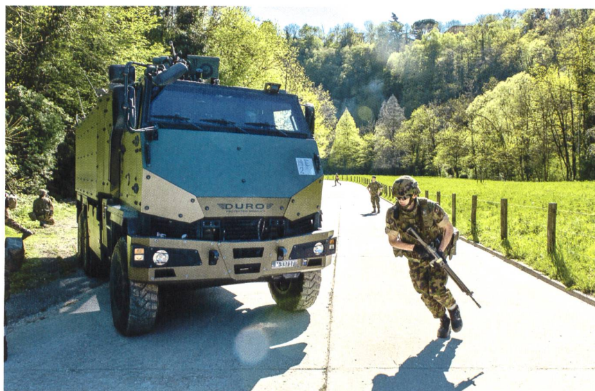
Alcuni esponenti dei Volpodinghi alle prese con i militi del bat fant mont 30