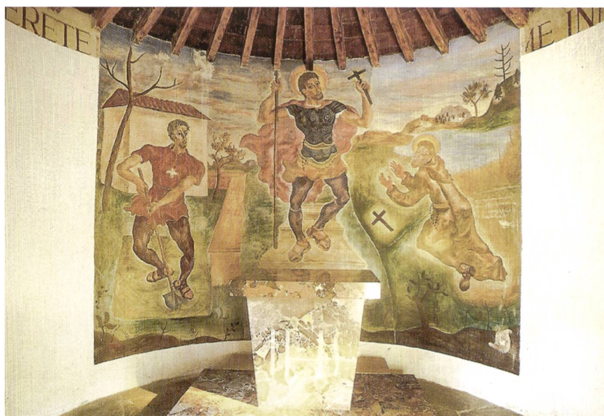
Affresco di Felice Filippini originale, raffigurante "Bruder Klaus", nella "Chiesetta dei soldati" al Monte Ceneri

La convivenza pacifica, la capacità di rimetterci in discussione (ricordiamoci che San Nicolao ha abbandonato la carriera per