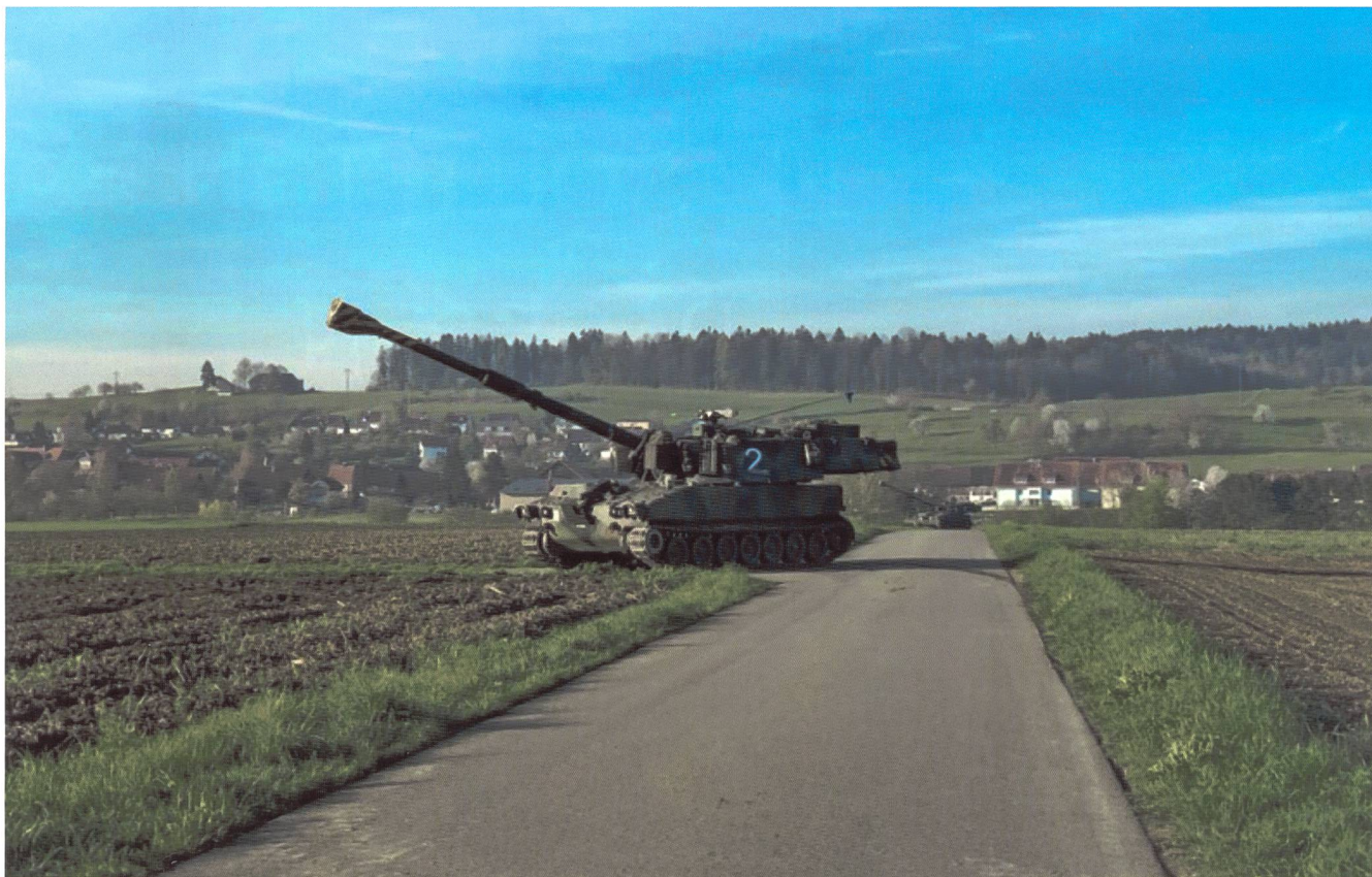
Durante l'esercizio "POLEMOS 19" i pezzi del gr art 49 hanno attraversato in lungo e in largo le campagne nei dintorni di Frauenfeld

settimana ha visto gradualmente entrare in servizio buona parte dei militi (tenendo conto di effettivi complessivamente ridotti a poco più del 50% degli astretti al servizio) per garantire il ritiro e il trasporto del materiale, il ritiro e il carico su treno dei cingolati e quindi i lavori di preparazione nel settore Frauenfeld – Toggenburgo – Säntisalpén, con truppe dislocate in ben sette località sparse sul territorio