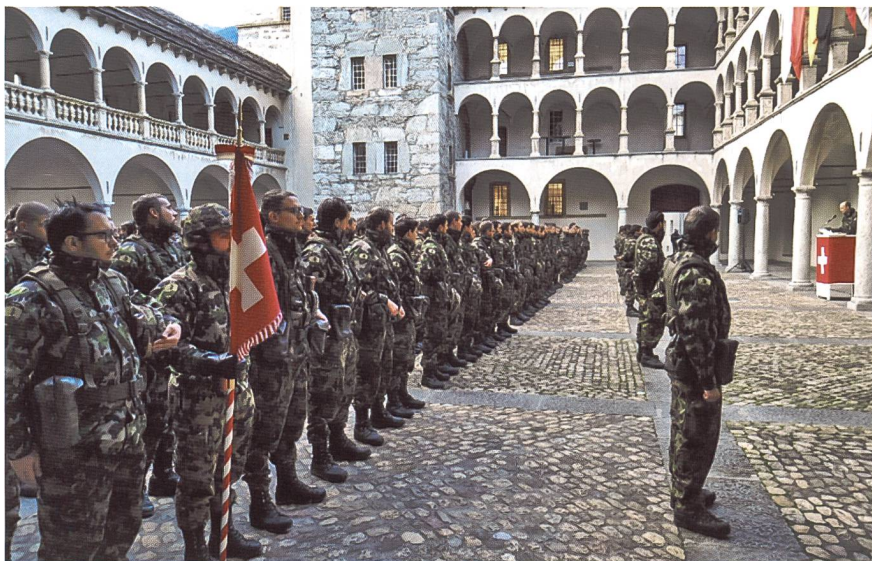
La cerimonia di riconsegna dello stendardo a Briga

Quasi neppure un mese è infatti passato prima che i quadri dello stato maggiore e delle batterie fossero chiamati a preparare un nuovo servizio in un nuovo settore, ancora più ampio