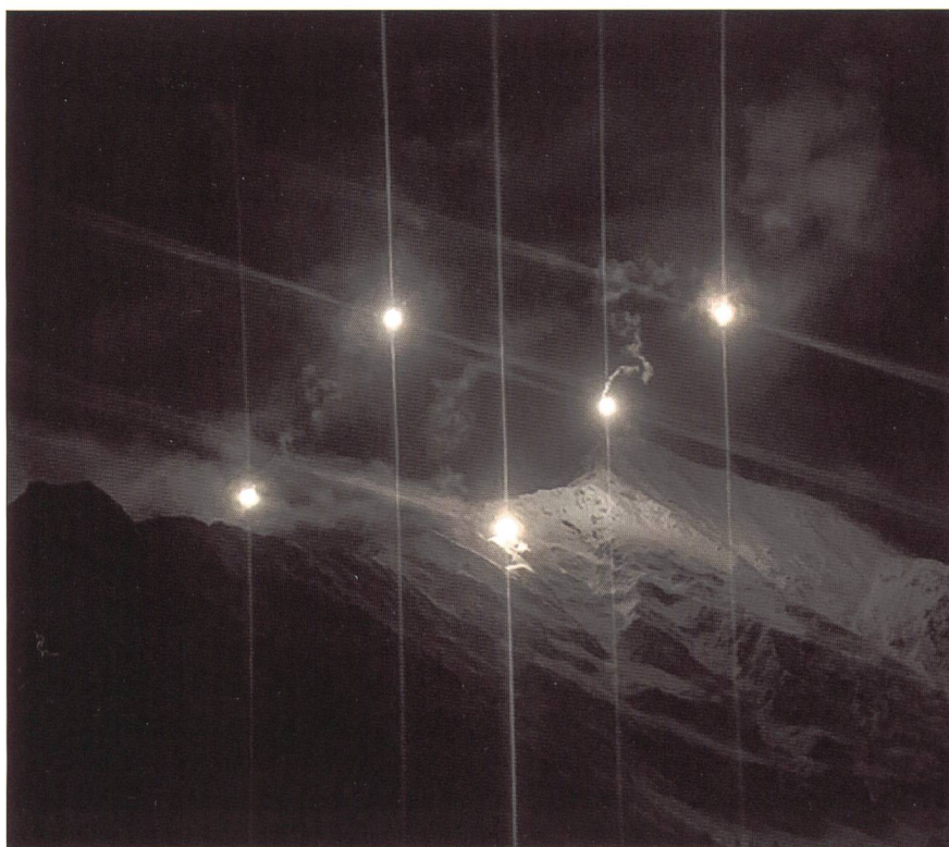
Un impressionante scatto del tiro notturno sul Sempione

dei veicoli cingolati dal treno partito il venerdì precedente dalla stazione di Gampel-Steg. Dopo aver preso ciascuna il proprio settore nella zona di prontezza a nord di Aigle, fino alle sponde del Lemano, le batterie si sono mosse con un impiego a elementi alternati verso una prima zona delle posizioni nella regione di Monthey – Saint-Maurice e