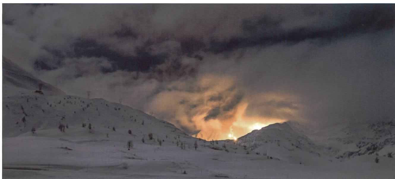
Il fuoco d'artiglieria del 49 illumina le vette sul Passo del Sempione