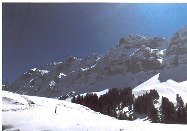
Il tiro mitr e il tiro diretto d'artiglieria nel maestoso scenario del versante nord del Säntis