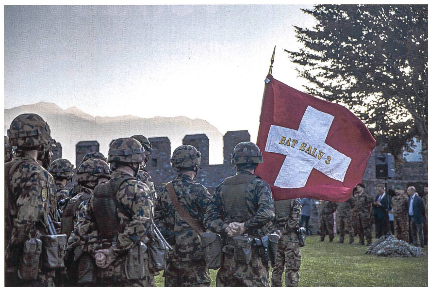
Il battaglione di salvataggio 3: certificato e pronto all'impiego

Particolarmente positiva è stata la valutazione sulla tecnica d'intervento, ambito in cui le compagnie di salvataggio hanno svolto un lavoro eccellente. Un punto di miglioramento per il futuro è invece il comportamento tattico, ovvero