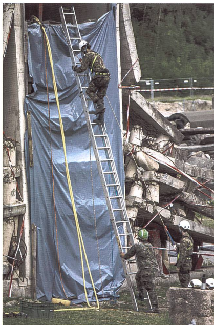
Intervento sulle macerie di Epeisses (GE)

La fase successiva dell'esercizio ha imposto la divisione del battaglione su due settori d'impiego. Una compagnia è stata indirizzata verso Mont-Vully