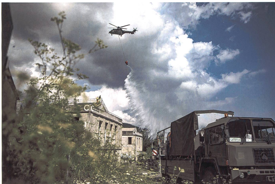
Anche le forze aeree hanno collaborato a spegnere gli incendi

bat salv 3 è stato richiesto un ultimo sforzo: intervenire nel settore dell'alta Leventina in una missione di trasporto acqua e lotta fuoco. Il battaglione si è così ricongiunto mercoledì mattina ai piedi del San Gottardo per pianificare, malgrado la stanchezza, questo impiego finale. Le esercitazioni, svoltesi a Ronco e nei pressi della galleria del San Gottardo, si sono concluse verso mezzogiorno. Dopodiché, mentre la truppa organizzava il ripiego di mezzi e materiale, lo stato maggiore di battaglione e i comandanti di compagnia sono stati riuniti alla caserma di Airolo per la critica d'esercizio. La stessa è stata diretta dal