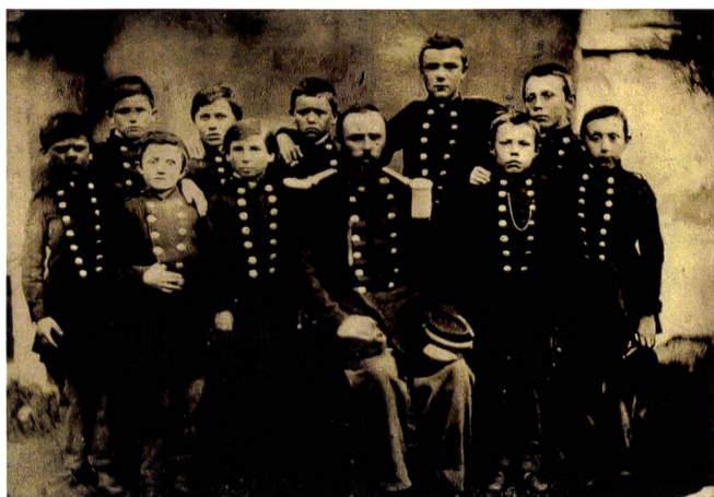
Cadetti del Pio Istituto (1866 – 1874). La foto raffigura i cadetti del Pio Istituto di Olivone. Questo istituto scolastico nacque come scuola privata (equiparabile a una scuola elementare maggiore) nel 1850 e per onorare la legge del 29 ottobre 1851 sull'istituzione dell'istruzione militare nelle scuole secondarie fondò un proprio distaccamento di cadetti. Il Pio Istituto accoglieva i giovani della valle di Blenio, per cui le dimensioni del corpo non furono mai enormi. Inoltre a causa del suo status di scuola privata, l'istituto dovette pagarsi di tasca propria i costi dell'istruzione e dell'armamento per i cadetti. Autore e anno dello scatto sono sconosciuti, dall'uniforme si può però desumere che si tratti di quella entrata in vigore con il secondo regolamento (intuibile dalla giacca a doppiopetto e dai bottoni in metallo "bianchi"): l'immagine si situerebbe quindi tra il 1866 e il 1874. A oggi si tratta dell'unica foto conosciuta che immortalò i cadetti ticinesi e il loro istruttore. L'ufficiale seduto è il capitano, nonché Municipale di Olivone, Vincenzo Bolla, circondato da alcuni dei suoi giovani allievi, tra i quali Alfredo e Pompeo Emma.

Solo nel 1852 con la secolarizzazione di tutti gli ordini insegnanti religiosi del Cantone e la seguente creazione dei ginnasi cantonali e del liceo di Lugano, alcune resistenze vennero sciolte e si assistette alla creazione del corpo dei cadetti del Canton Ticino, dove ogni scuola secondaria costituiva un singolo distaccamento. Tuttavia non fu un inizio facile: le resistenze agli esercizi militari non scemarono mai del tutto, specialmente dopo l'introduzione del primo regolamento per l'istruzione militare del 29 ottobre 1851, che prevedeva l'acquisto di una divisa, composta da "una tunica di fustagno oscuro a doppio petto, in un bonetto a cono troncato di tela, cerata nera con visiera: - si raccomanda pure il pantalone di color oscuro" da parte delle famiglie. I soliti problemi di mancanza di fucili e istruttori non vennero mai completamente risolti, e anche la disciplina degli allievi si dimostrò inizialmente scarsa, dal momento che essi scambiavano gli esercizi per dei giochi. Un esempio: al collegio Papiro d'Ascona l'ispettore scolastico fu costretto a intervenire per ristabilire la disciplina, dopo che un allievo sputò in faccia all'istruttore e questi come reazione sfoderò la sciabola e proruppe in escandescenze. La nuova sfida consisteva ora nel consolidare e far accettare la nuova istruzione militare in tutto il Cantone. ♦