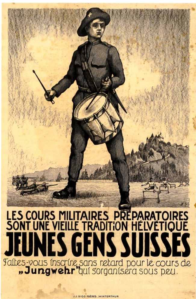
Jeunes Gens Suisse. Manifesto degli Anni 20-30 per promuovere i corsi militari preparatori. Sin dal 1880 si erano creati corsi militari per cadetti "esterni" alla scuola e gestita da circoli di ufficiali. Inoltre in molti corpi la partecipazione era su base volontaria e non sempre obbligatoria.