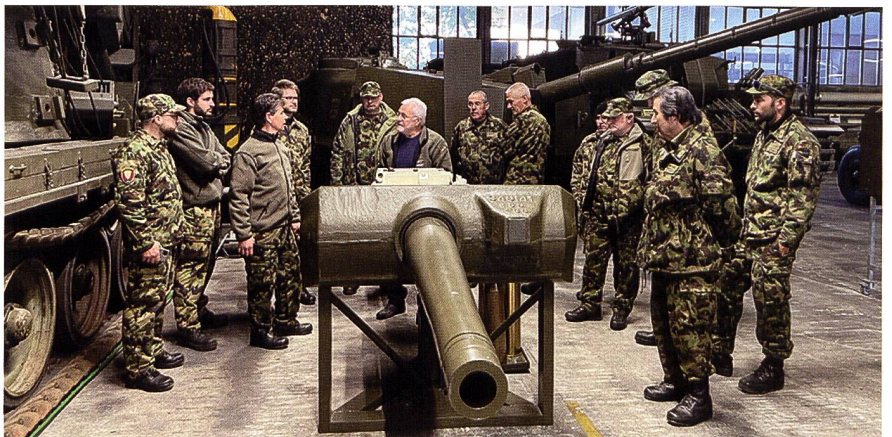
Un momento della visita