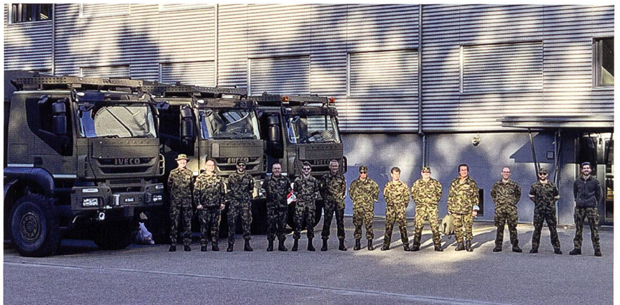
Partecipanti al Corso Autocarri II davanti alla Caserma di Burgdorf