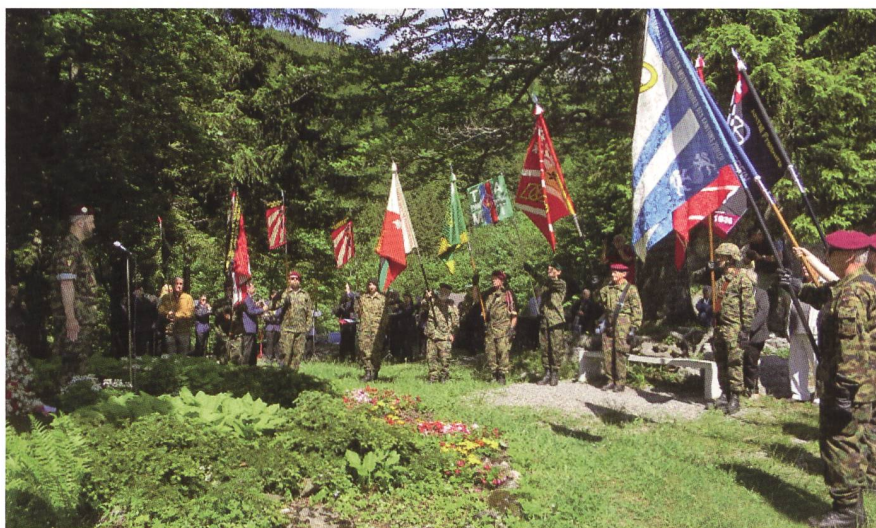
I vessilli delle Associazioni cantonali rendono omaggio.

giovani conducenti, visita al nuovo Centro veicoli del Monte Generi. Per essere sempre aggiornati sulle nostre attività visitate il sito: < www.attm.ch >. Siamo inoltre sempre a disposizione