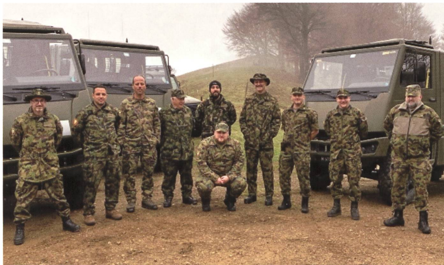
Una parte dei partecipanti al Corso, in posa e in azione.

classificati) e un ricco bagaglio di esperienza da spendere nell'organizzazione delle future gare ticinesi. Ecco uno stralcio della loro relazione: "la Gara si è rivelata una manifestazione molto interessante e variegata. Pianificata su una durata di circa trenta ore ben si capisce come all'importante attività di guida si siano alternati momenti di attività militare, di riposo e ristoro. La competizione vera e propria è iniziata alle 13.00 di venerdì 20 maggio e si è conclusa sabato alle 18.00 circa. Venerdì ci sono state prove nel pomeriggio e nelle ore serali-notturne, la cena in comune con relativa visita a un museo militare privato (che comprendeva innumerevoli pezzi della storia militare Svizzera) e il pernottamento in un accantonamento predisposto. Nel corso del sabato si sono svolte nuovamente missioni. Il pranzo è stato offerto allo stand dove si sono svolte le competizioni di tiro, le