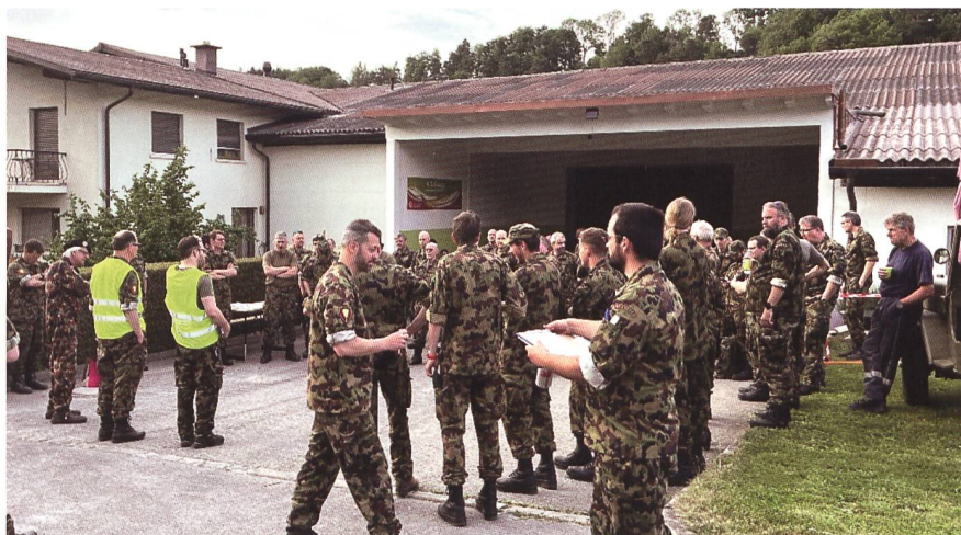
Ultime istruzioni e poi: occhio alle cartine e... alla strada.

Ricordiamo che l'Associazione offre i propri servizi di trasporto in varie manifestazioni. Quest'anno è finora stato il caso per il Military Cross di Bellinzona e per la Giornata di porte aperte del CIFS di Isonne. Altre seguiranno, così come numerose attività sono in programma: corsi veicoli pesanti e leggeri, corso veicoli leggeri abbinato a visita culturale, serata informativa per