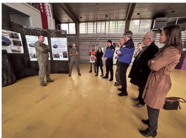
In occasione della giornata della PM, circa 60 ospiti e pensionati hanno avuto modo di conoscere le esclusive capacità della Polizia militare odierna.

organizzazione. L'evoluzione e le diverse riorganizzazioni della Polizia militare hanno accompagnato fino a oggi la storia di questa organizzazione. "I nostri predecessori ci hanno mostrato il cammino", ha ricordato il comandante, "ed è grazie alle generazioni passate se oggi siamo giunti fin qui". La giornata della PM vuole essere anche un'occasione per ricordare questi contributi, per onorare i predecessori e riconoscere gli sforzi compiuti in passato. Gli ospiti a Sion hanno potuto scoprire da soli, nell'ambito di una piccola dimostrazione dei mezzi usati al giorno d'oggi, il percorso di evoluzione che ha compiuto la Polizia militare in questi anni.