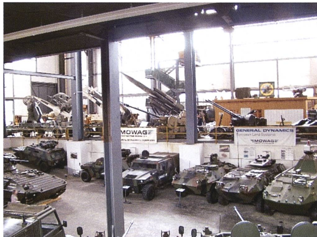
Sguardo su una parte della collezione del Museo di Reuenthal.

ha la possibilità di affinare competenze e capacità.