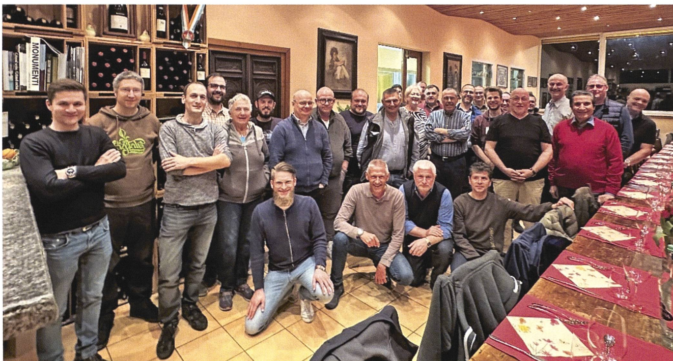
Foto di gruppo al termine dei lavori assembleari.

Un impiego su due giornate e con una tale dislocazione dalla Base ha richiesto uno sforzo organizzativo importante, un impegno supplementare a livello di gestione logistica dei veicoli e, non da ultimo, forte impegno alla guida. Prova superata per l'organizzazione che, confrontata con simili impieghi,