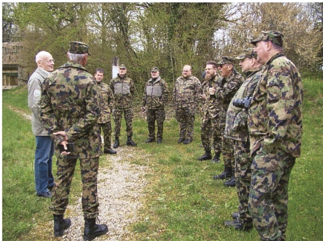
Gruppo di partecipanti orientato prima della visita alla Fortificazione di Full.