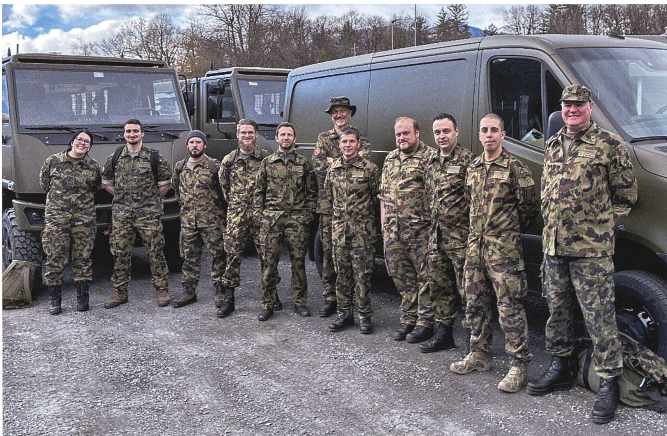
Fine impiego per il Distaccamento ATTM e per i responsabili auto al Military Cross 2023.