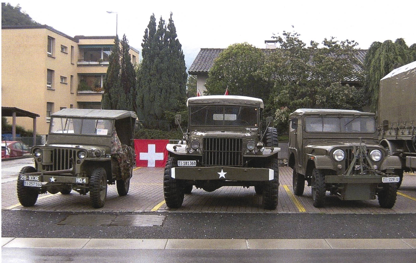
Incontro insubrico veicoli militari d'epoca nell'aprile del 2014 a Canobbio.

Altre informazioni sono disponibili sul sito: < https://www.haflipinz.ch/ > ♦