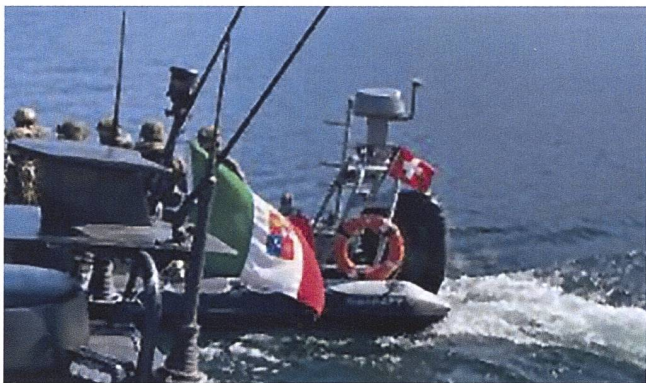
Collaborazione senza frontiere.