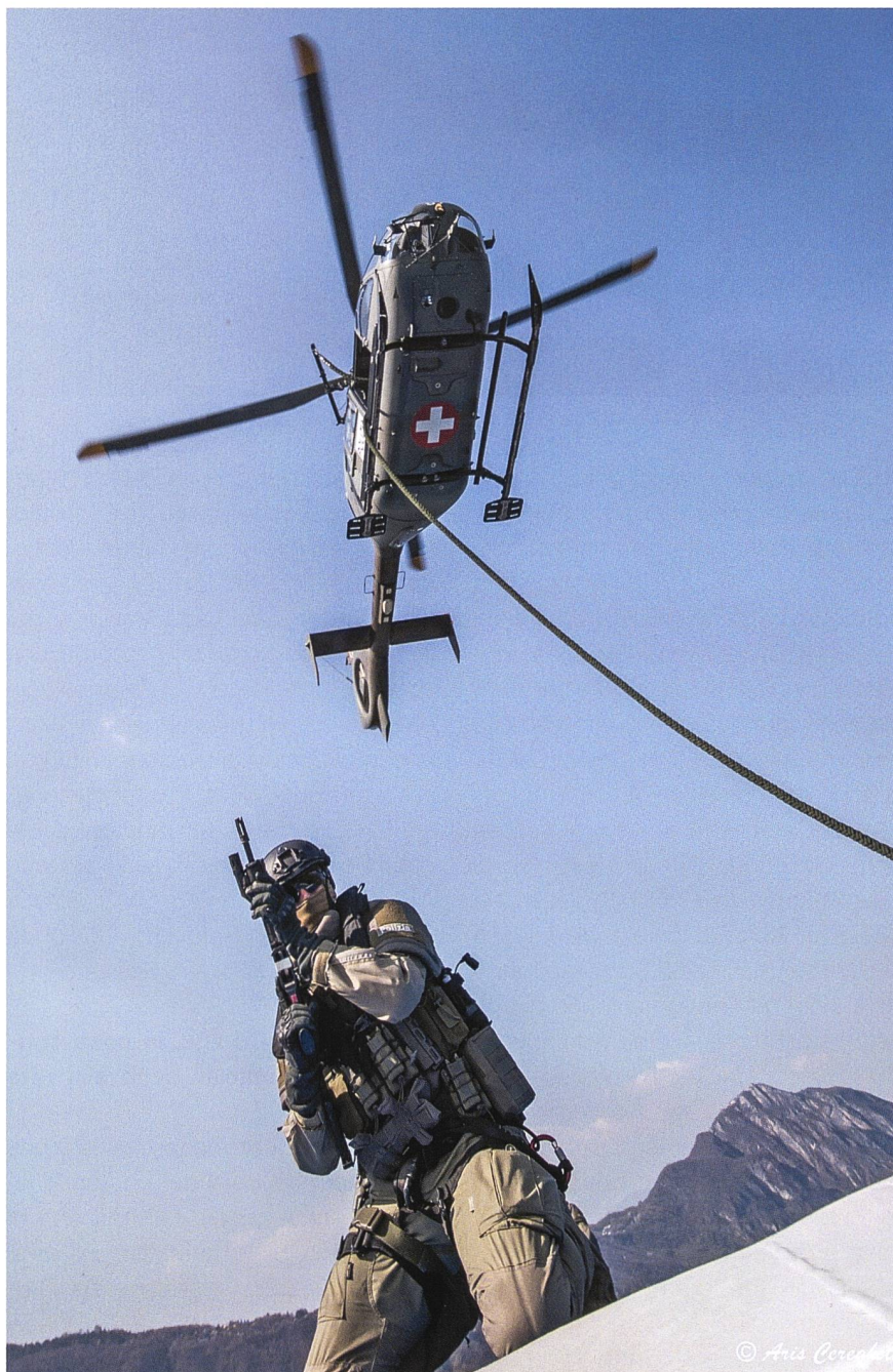
Polca TI e elicottero in ingaggio.

questa funzione, come deciso dalla Conferenza dei comandanti delle polizie cantonali svizzere (CCPCS), vi è pure la responsabilità di rappresentare la Confederazione nell'ambito della rete ATLAS. Partecipo quindi ai due Commander forum annuali, che si svolgono sull'arco di più giorni in capitali europee, dove sono discusse le strategie della rete, sono presentate operazioni di rilievo e sono coordinate le varie attività con la possibilità di coltivare le relazioni, anche dirette, con i vari comandanti.