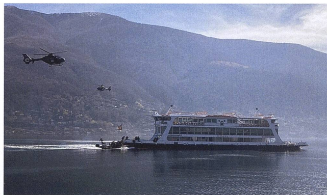
Abbordaggio del battello in ostaggio.

mancare, la rete ATLAS può fornire un quadro di riferimento anche per richiedere assistenza. Gli Stati non membri dell'UE (Svizzera, Norvegia, Islanda e Regno Unito) possono partecipare a tutte le attività organizzate dalla rete ATLAS, non disponendo però di un diritto di voto nell'ambito del Commander forum, gremio che raggruppa tutti i Comandanti nazionali e che si riunisce due volte all'anno. Dal novembre 2018, l'Ufficio di supporto ATLAS ha sede presso la sede centrale di Europol, ospitato all'interno del Centro europeo antiterrorismo con sede all'Aia, nei Paesi Bassi. Questo garantisce che la rete sia costantemente supportata internamente e direttamente collegata ad altre reti di forze dell'ordine e agenzie. In quest'ambito Europol fornisce supporto finanziario e materiale alle decine di esercitazioni condotte annualmente dalla rete.