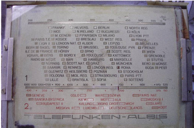
1933. Una "Scala parlante" tra le prime. (1) Onde Medie [OM] e (2) Onde Lunghe [OL] (©Museo della Radio, MdR).