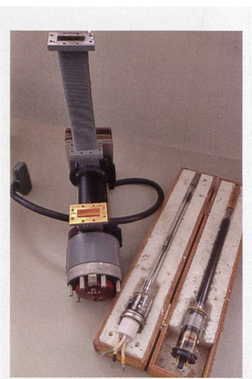
TWT e loro contenitore con guida d'onda; L = 30 cm ca.