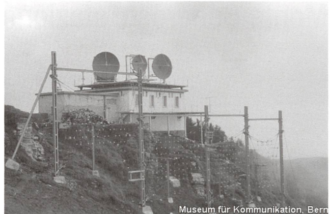
1948. Monte Generoso.

applicata con successo una frequenza attorno ai 2 GHz, (lunghezza d'onda di ca. 15 cm), abbastanza elevata, adatta a formare il fascio direttivo.