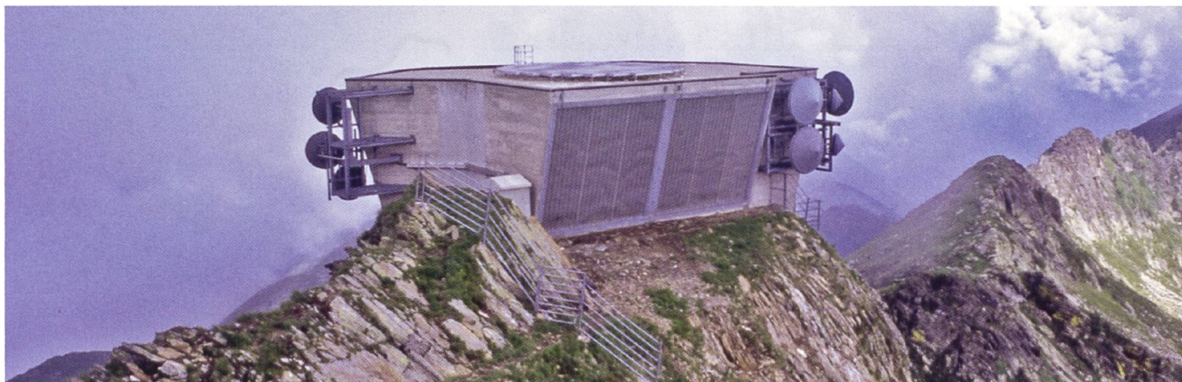
Stazione ponti radio del GESERO, 2227 m.s.m. (©MdR).

Monte Generoso viene costruito, dopo il Monte Ceneri, il secondo impianto radio del Cantone Ticino. Non più onde medie, bensì onde di frequenza ultra alta (UHF). Si tratta della stazione ponti radio iniziata con un'antenna parabolica in direzione della Jungfrau e un'altra in direzione di Milano.