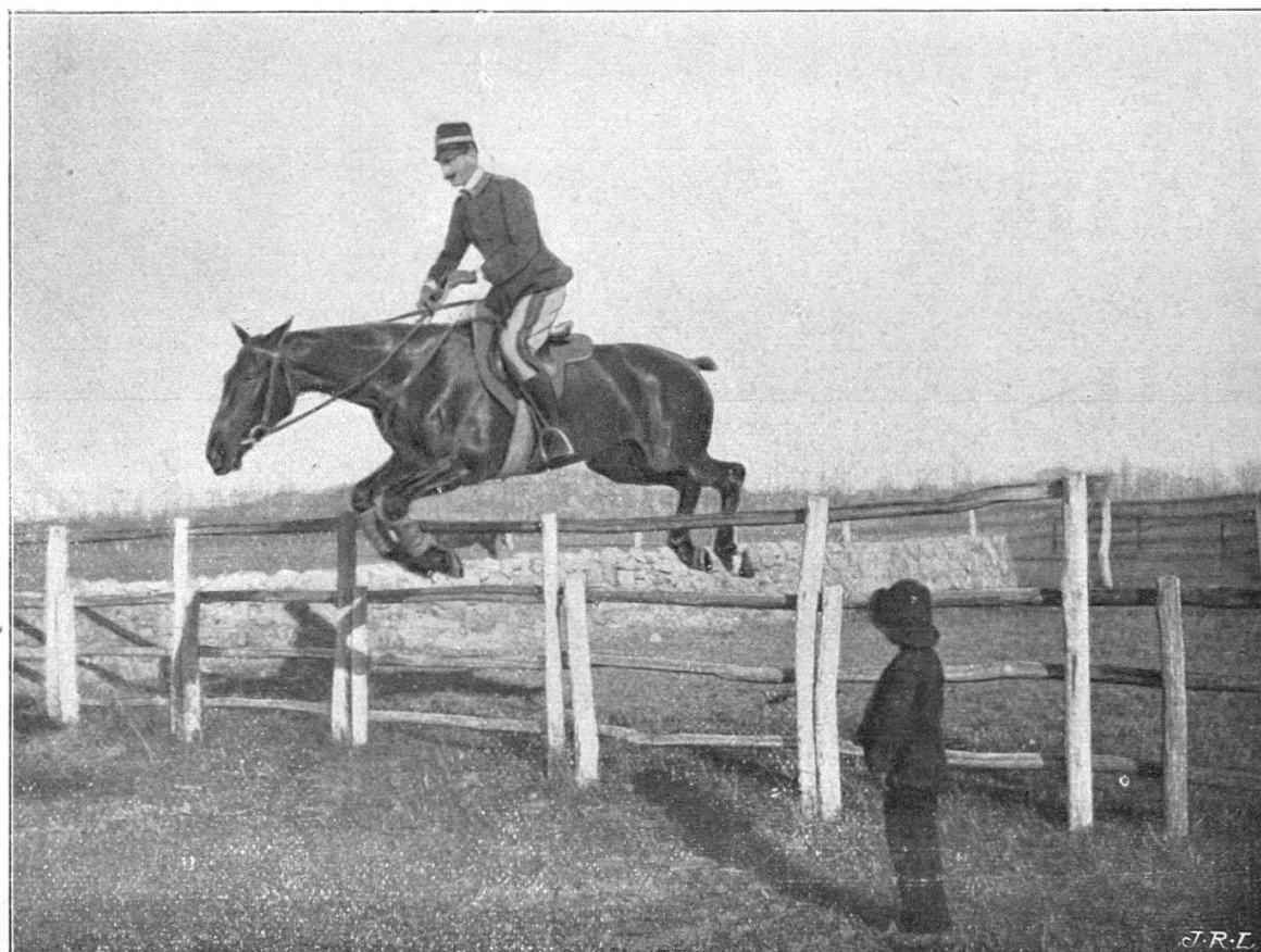
FIG. 2. — Le Capitaine Caprilli.