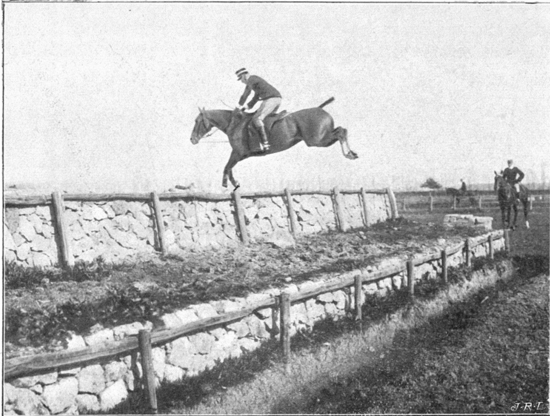
FIG. 1. — Le Parapet, dit le « Piano Forte »