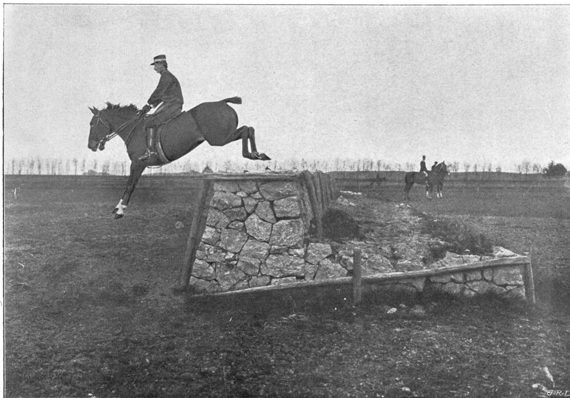
Le Parapet, dit le « Piano-Forte »