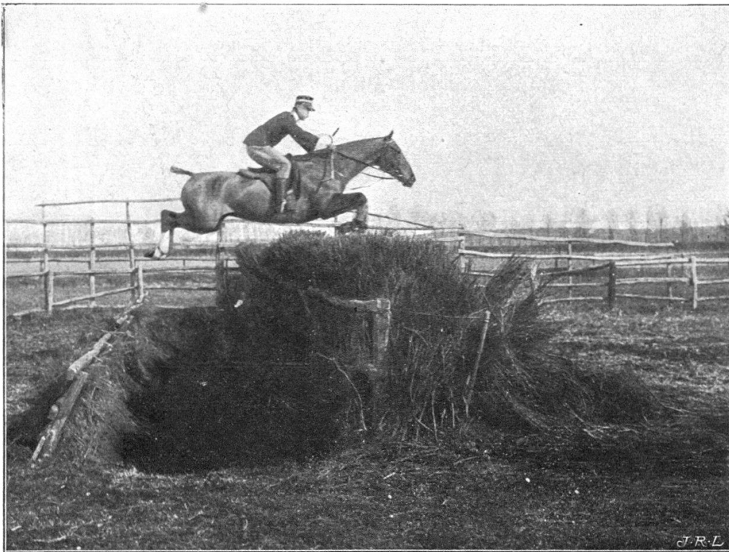
FIG. 2. — La Fence.