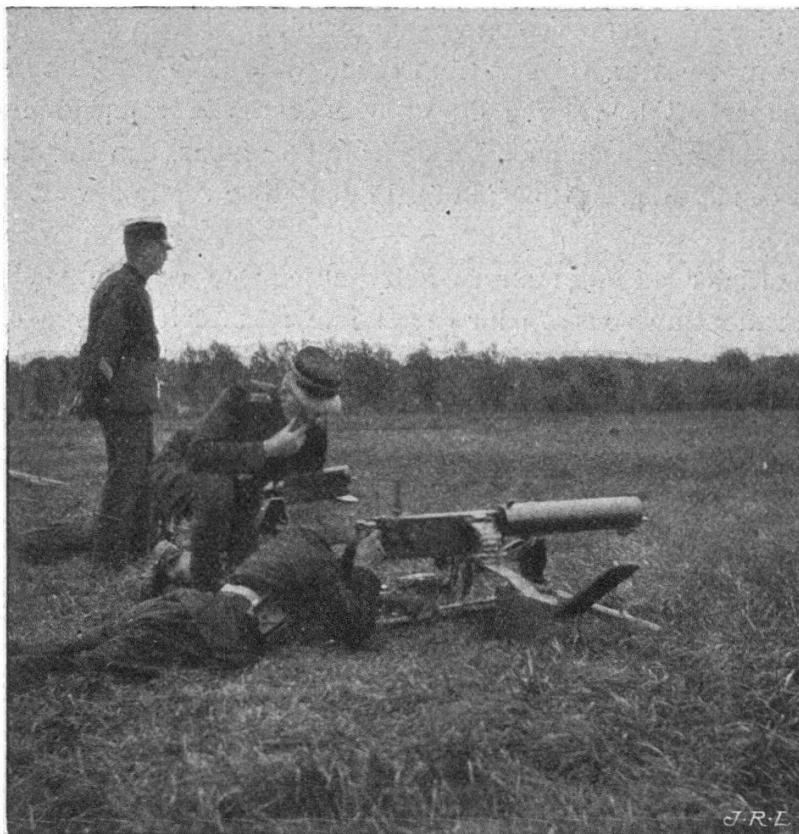
Tir d'école couché.

Les mitrailleurs sont armés du fusil court avec bayonnette quadrangu-