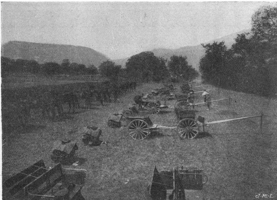
Bivouac à Villars-sous-Champvent.