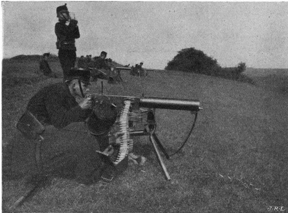
Tir d'école assis.

les commandants d'infanterie, l'étude et la pratique en commun étaient grandement nécessaires. L'école a été licenciée le 28 septembre.