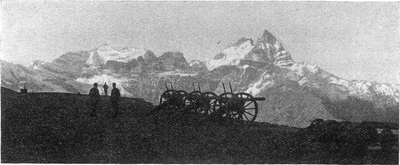
Forteresse. — Canons à Riondaz.

On a beau poser en principe qu'aucun citoyen ne doit ignorer les lois,