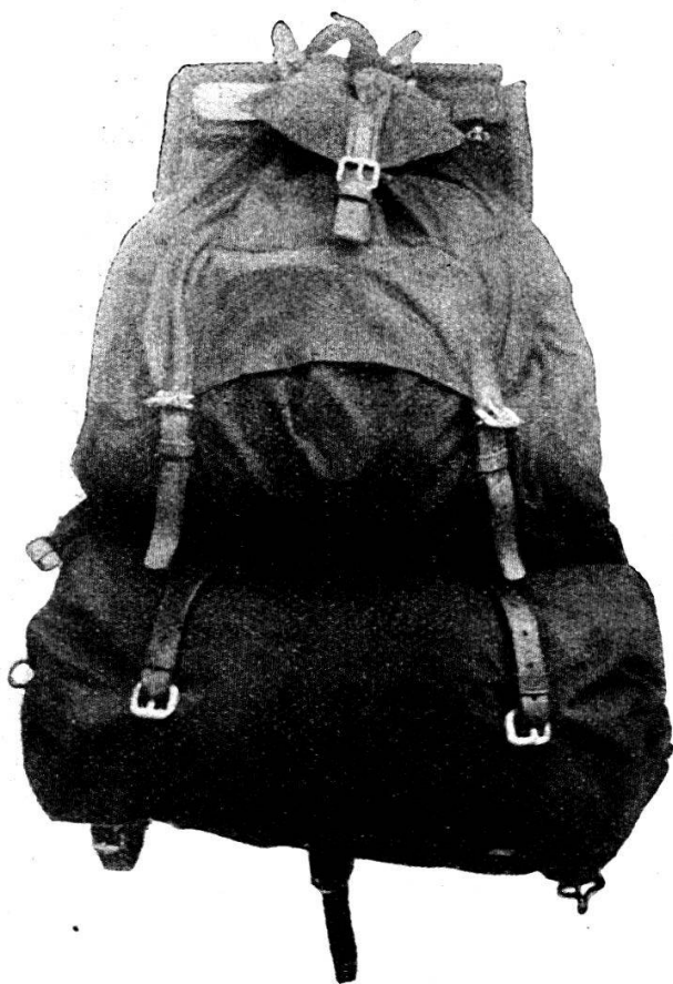
Le paquetage complet.

Poids total de l'effet d'équipement, » 1550 gr. au lieu de 2850 gr. que pèsent, réunis, le havre-sac et le sac à pain actuels.