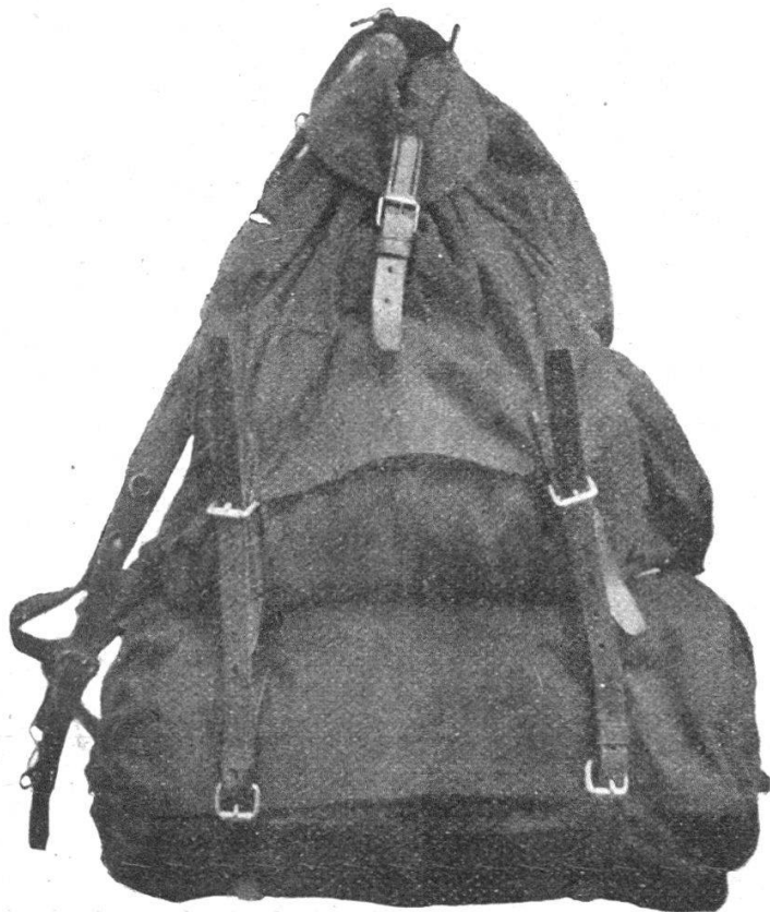
Le paquetage réduit .

En un paquetage réduit aux vivres et munitions , en détachant les deux sacs pour vêtements et chaussures et pour manteau ;