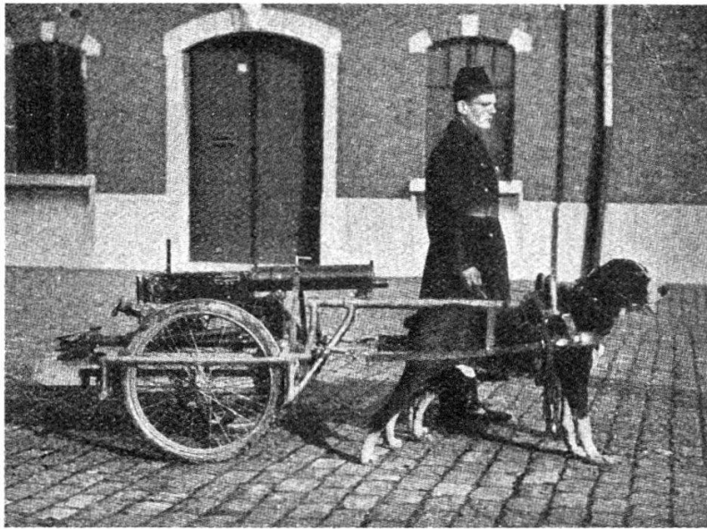
La mitrailleuse attelée.

Au cours de l'année 1911, les lieutenants Blancgarin et Vandeputte du régiment des carabiniers, conçurent le projet d'utiliser les chiens pour la traction de voiturettes portant les mitrailleuses et de les substituer aux chevaux de bât et aux autres modes de transport existant ou préconisés en