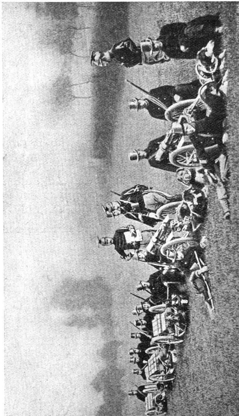
Au repos (officiers de cavalerie spectateurs). 2 mitrailleuses et 3 caissons).

la boiterie est très rare chez cet animal, et l'on sait le nombre effrayant de kilomètres qu'abattent à la course et à la chasse,