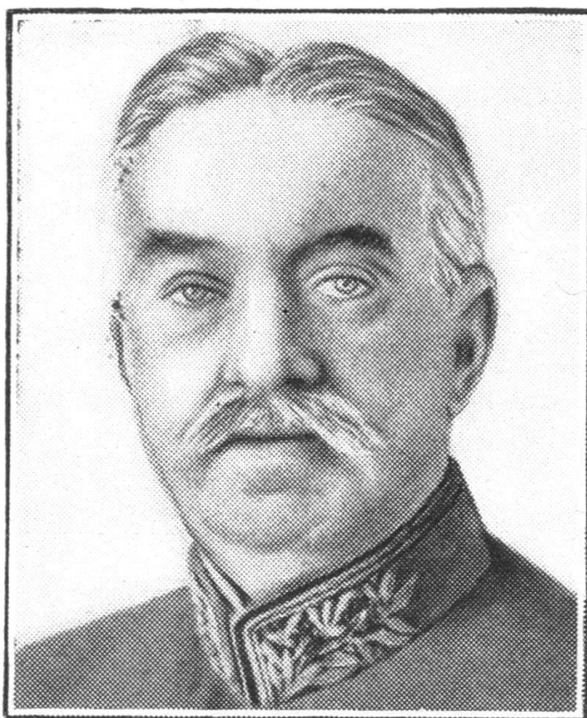
Le général Ulrich Wille.

l'instruction de l'armée. C'est farci d'excellents principes, de bonnes intentions et de sages conseils, nul ne le contestera, mais il a fallu toute notre bonhomie et notre désir de discipline pour ne pas rire ouvertement de ce filandreux sermon sur la montagne. On ne galvanise pas les soldats welsches avec des discours de ce genre, et les soldats welsches appartiennent aussi à l'armée. Si l'on veut être leur chef, il faut savoir leur parler leur langage comme aux soldats de la Suisse allemande le leur.