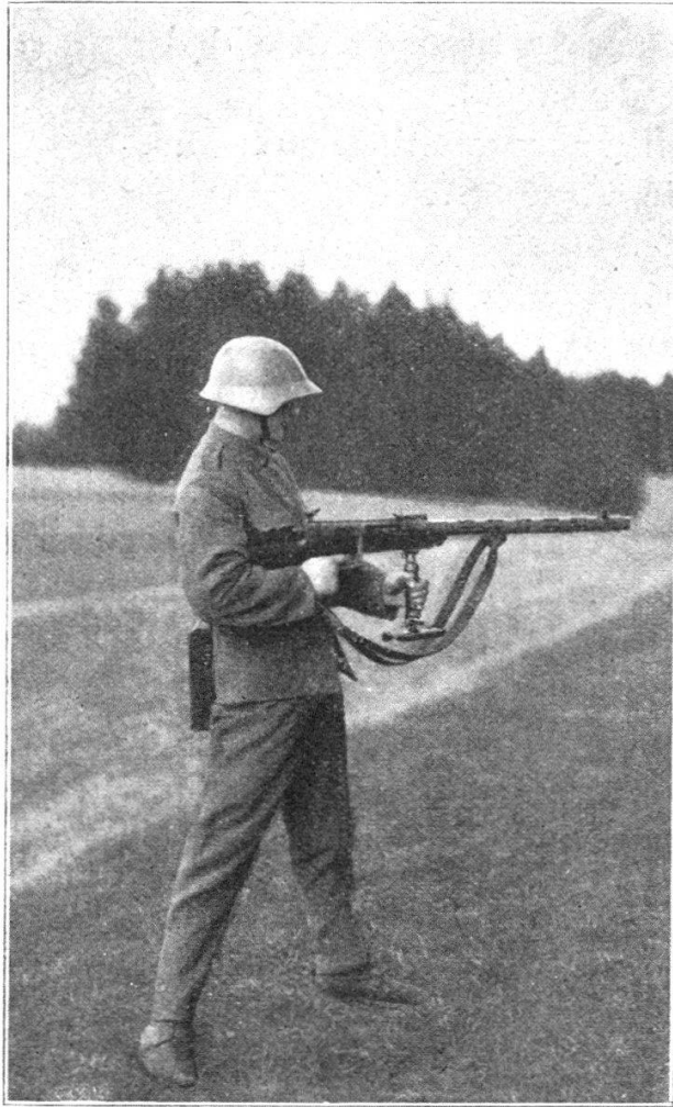
Fig. 5. Tir l'arme sous le bras (le tireur règle son tir en observant l'arrivée des projectiles).

tions plus difficile. Les hommes de l'équipe ne sont plus des tireurs isolés, mais des servants, ayant chacun une tâche précise à remplir vis-à-vis de leur arme. Dans l'emploi de toute arme automatique, il faut que le personnel, le matériel accessoire et le ravitaillement en munitions assurent la continuité du feu.