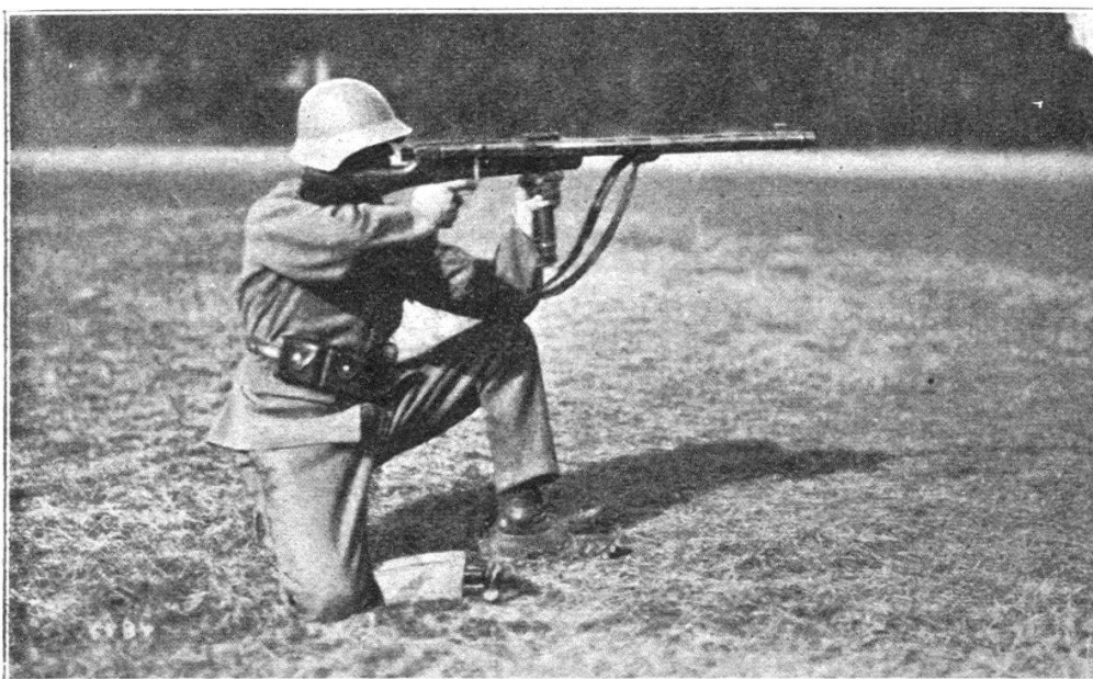
Fig. 3. Tir à genou (la main gauche tient l'arme par l'appui fixé au milieu).

d'utiliser tous les gaz pour le tir proprement dit. Un des grands avantages que présente la construction de notre F. F. est que toutes les pièces de la culasse ne subissent qu'une « pression » correspondant au travail à fournir. L'ouverture de la culasse se fait sans choc. On n'utilise que l'énergie nécessaire à l'extraction et à l'éjection du culot. La combustion de la poudre étant retardée (feuillettes graphitées et recouvertes d'un sel