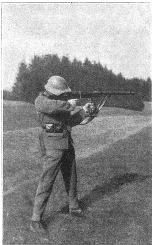
Fig. 4. Tir debout.

Le tir coup par coup est un tir d'exception. Par conséquent l'arme automatique agissant surtout par surprise, elle sera souvent contrainte de ne se dévoiler qu'au dernier moment. Le tir coup