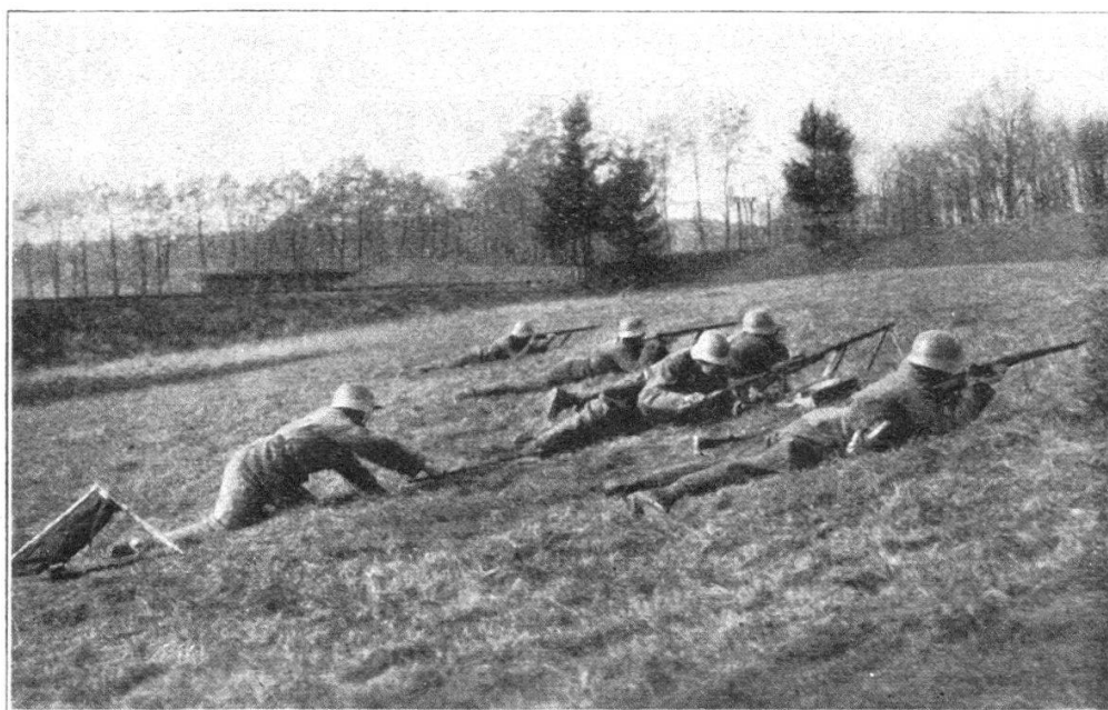
Fig. 8. Changement de canon pendant le tir de l'équipe. (Représentation schématique. Tuyau à eau pour le refroidissement du canon derrière la pièce.)

Mais si les formations ont changé, si la technique du feu a évolué et si l'armement est devenu plus complexe, nous de-