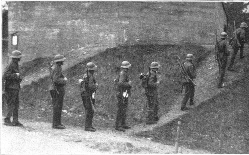
Fig. 6. Equipe de mitr. lég. en colonne par un : 1. caporal (jumelles) ; 2. tireur (Fusil Furrer et appui antérieur) ; 3. aide-tireur (porteur de l'étui avec canon de rechange) ; 4. 5. 6. pourvoyeurs des munitions (sac de 300 cart. et gourde à eau) ; 7. 8. Fusiliers-mitrailleurs. Cette répartition de matériel n'est pas définitive.

le temps disponible pour l'instruction. Il est presque superflu de répéter que si nous avons et la méthode et les hommes