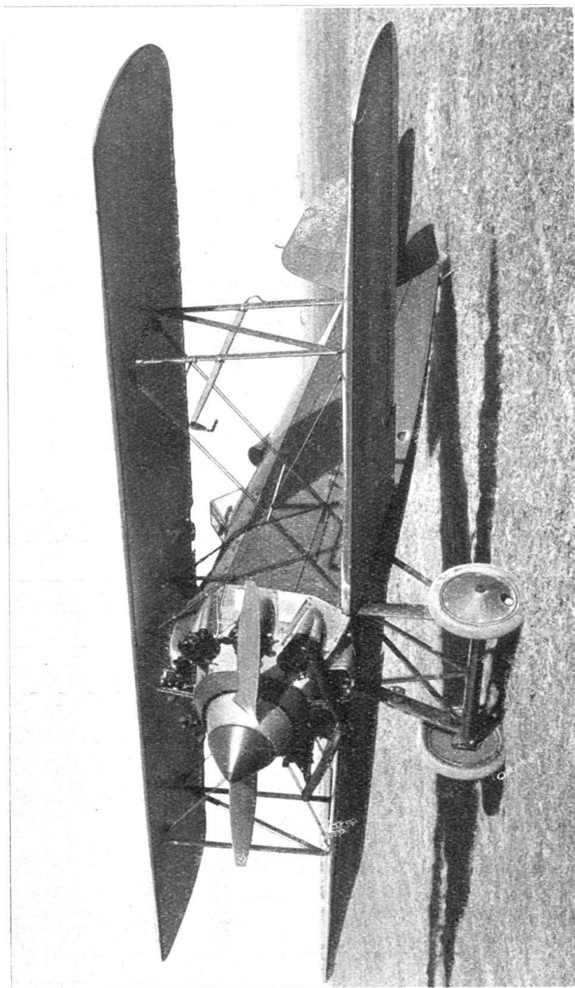
Le biplan monoplan Avia B H 33, 500 C. V.

en étoile, est de 500 CV. Les mitrailleuses Vickers, ou d'un type analogue, ont une réserve de 800 cartouches. Les fusées de signalisation sont disposées dans le poste de pilotage, à un endroit approprié, et le pistolet est monté à la droite du pilote.