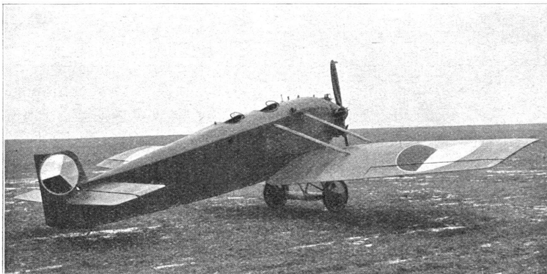
Le monoplan AVIA B H 11, 60 C. V. Appareil d'entraînement et de perfectionnement.

L'ensemble de l'aile est revêtu de contre-plaqué depuis son bord d'attaque jusqu'au longeron arrière. Les réparations sont considérablement facilitées grâce à cette construction. Le démontage des ailes peut être effectué en quelques instants par deux mécaniciens simplement : il suffit de retirer 10 boulons !