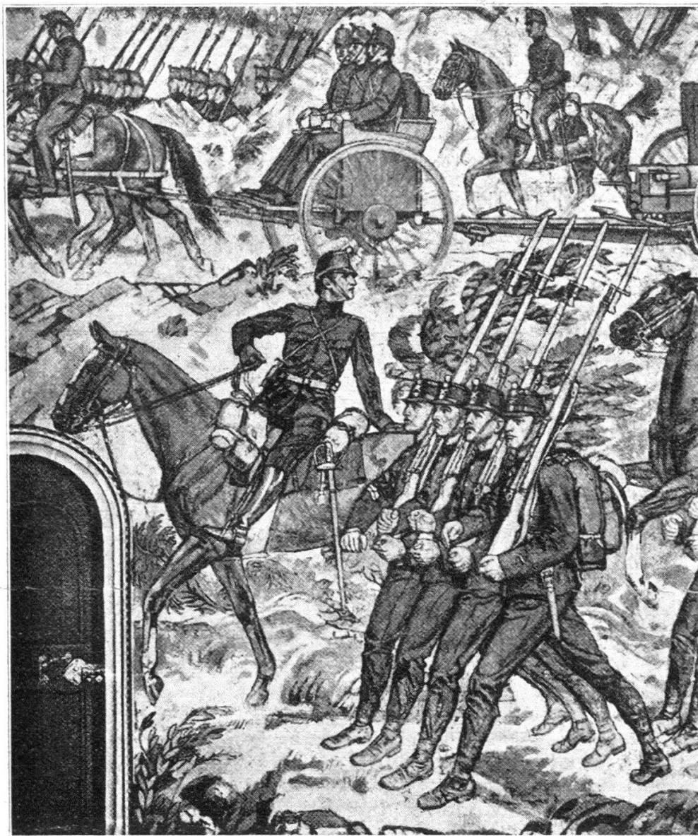
Salle des Chevaliers. Peintures de C. L'Eplattenier.

l'animateur. Il était mort subitement, en automne 1917, à Delémont, terrassé par une embolie. Ce fut pour le peintre une perte sensible ; il avait appris à connaître et à estimer