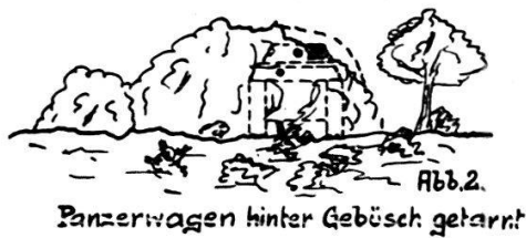
FIG. 2. — Char camouflé derrière un buisson.

camouflage, ou bien placés dans des positions préparées, telles que baraques, carrières, coudes de routes, etc. Si ces fortresses mobiles sont peintes de couleurs appropriées, elles seront très difficiles à repérer. Elles ne pourront être mises hors de combat que par des coups au but des canons lourds d'infanterie ou de l'artillerie, armes dont l'assaillant ne pourra, en montagne, faire qu'un usage restreint. De ce fait, le défenseur aura l'avantage. L'engin cuirassé enterré échappe entièrement à l'effet des éclats de projectiles. Un engin une fois repéré peut changer de position et se soustraire ainsi au feu de l'artillerie.