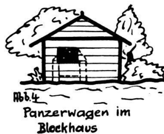
FIG. 4. — Char dans blockhaus.

Le char cuirassé peut aussi être utilisé pour compléter le réseau d'ouvrages permanents et pour les positions intermédiaires. Les dimensions du point d'appui ainsi créé sont données par le terrain ; il offre à l'ennemi un petit but tout en donnant un gros volume de feu, cela sans parler des avantages que lui donne sa mobilité. Le char impose à l'ennemi de sévères exigences, par le fait qu'il peut échapper à son tir. Seuls des coups fortuits de pièces d'infanterie ou d'artillerie peuvent le mettre hors de combat. Les chenilles lui permettent de s'engager sur de mauvais chemins et en dehors des chemins.