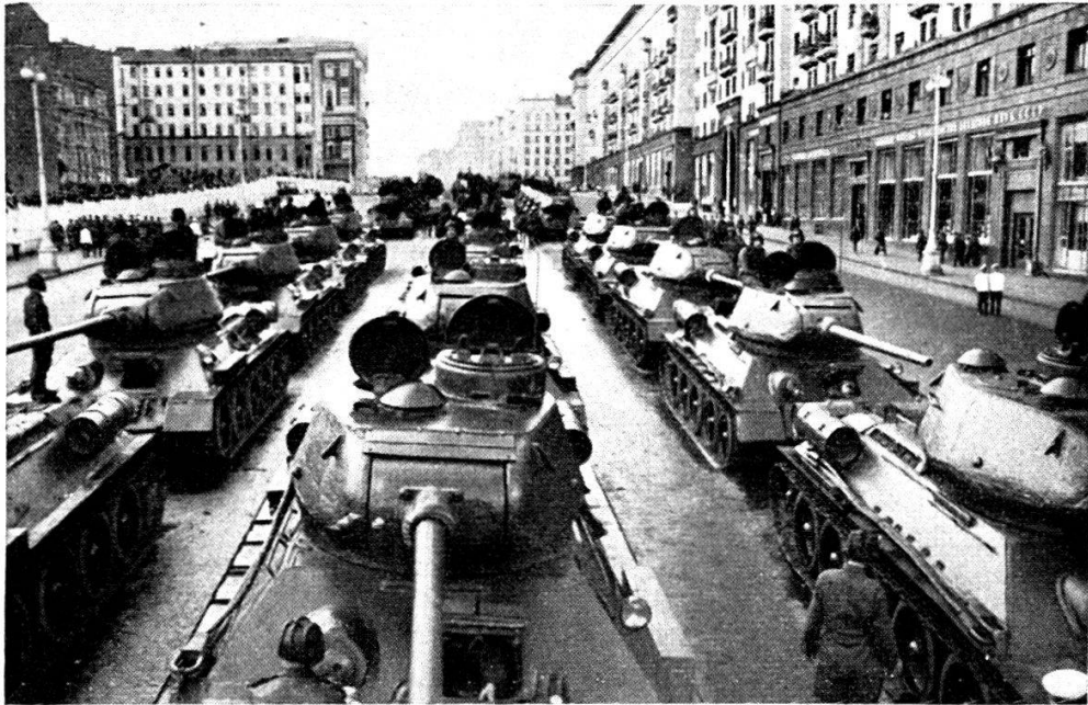
Ecole des tankistes à Moscou : Une division de chars qui avait poursuivi une lutte gigantesque jusqu'à Berlin.