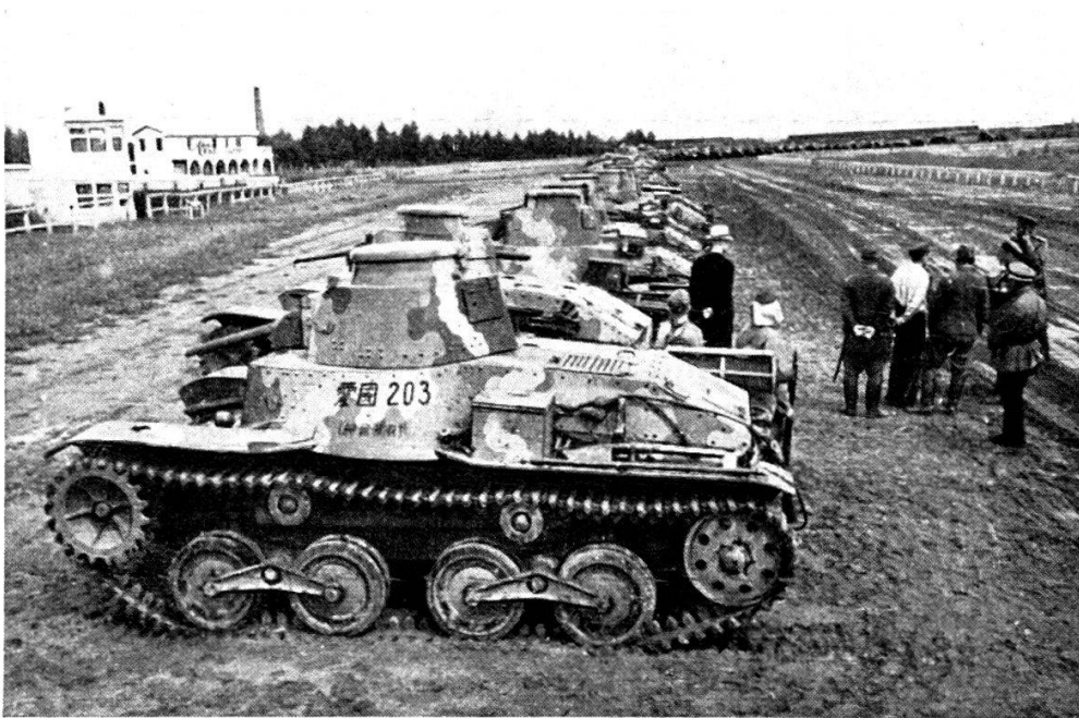
Ecole des tankistes à Moscou : Arrivée de tanks et tankistes à Kharbine.

Le général Katoukov se distingua dans la bataille devant Koursk, qui conduisit l'armée allemande à la catastrophe.