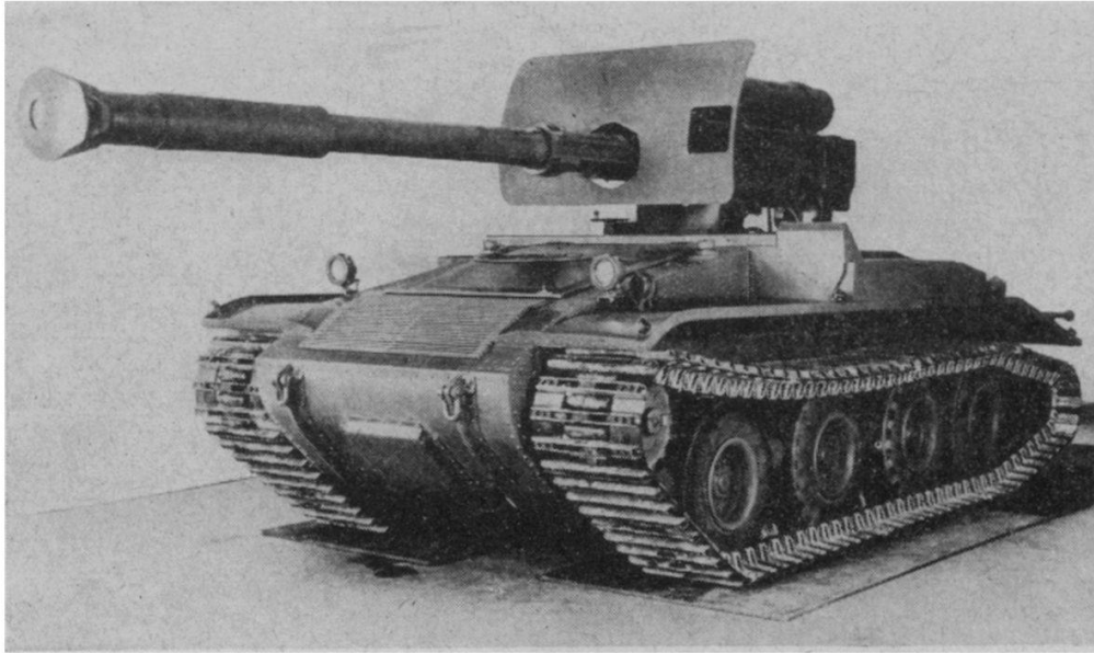
FIG. 2. — Canon chenillé antichars de 90 mm.

moins de 8 tonnes contre 16 à notre G13 et 30 au SU85 . Son moteur de 205 chevaux lui assure une vitesse maximum de 48 kmh. Enfin, sa légèreté et ses dimensions lui permettent de prendre place à bord d'un avion de transport du type C119 ,