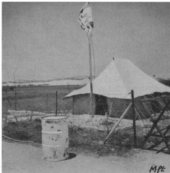
Poste frontière israélien sur la route de Gaza. Au deuxième plan à gauche : un camp des « casques bleus ». Au dernier plan à droite : un poste d'observation.