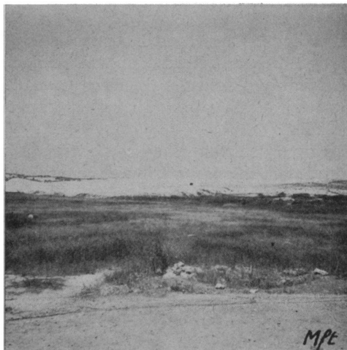
Poste d'observation des « casques bleus ». Vu du poste israélien ci-dessus.