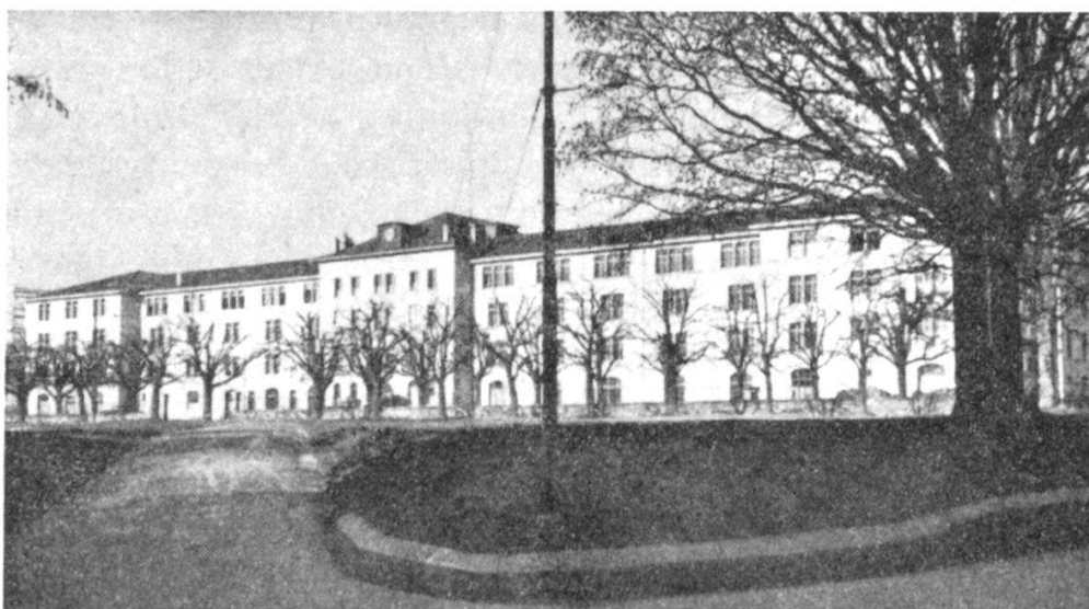
La caserne de Lausanne rénovée.

sont réduites ; les milices cantonales ont vécu. La législation militaire appartient à la Confédération ; les cantons demeurent organes d'exécution. Le citoyen suisse apte au service, sert de 20 à 44 ans, en élite d'abord, en landwehr ensuite ; le landsturm ne viendra que plus tard. Il est astreint dans l'infanterie à une école de recrues de 45 jours et, tous les deux ans, à un « cours de répétition » de 16 jours pour les fusiliers et les carabiniers. Les futurs lieutenants suivent une école d'officiers de 42 jours. Le chef d'arme de l'infanterie, assisté d'instructeurs d'arrondissement, est à la tête d'un corps d'officiers de carrière.