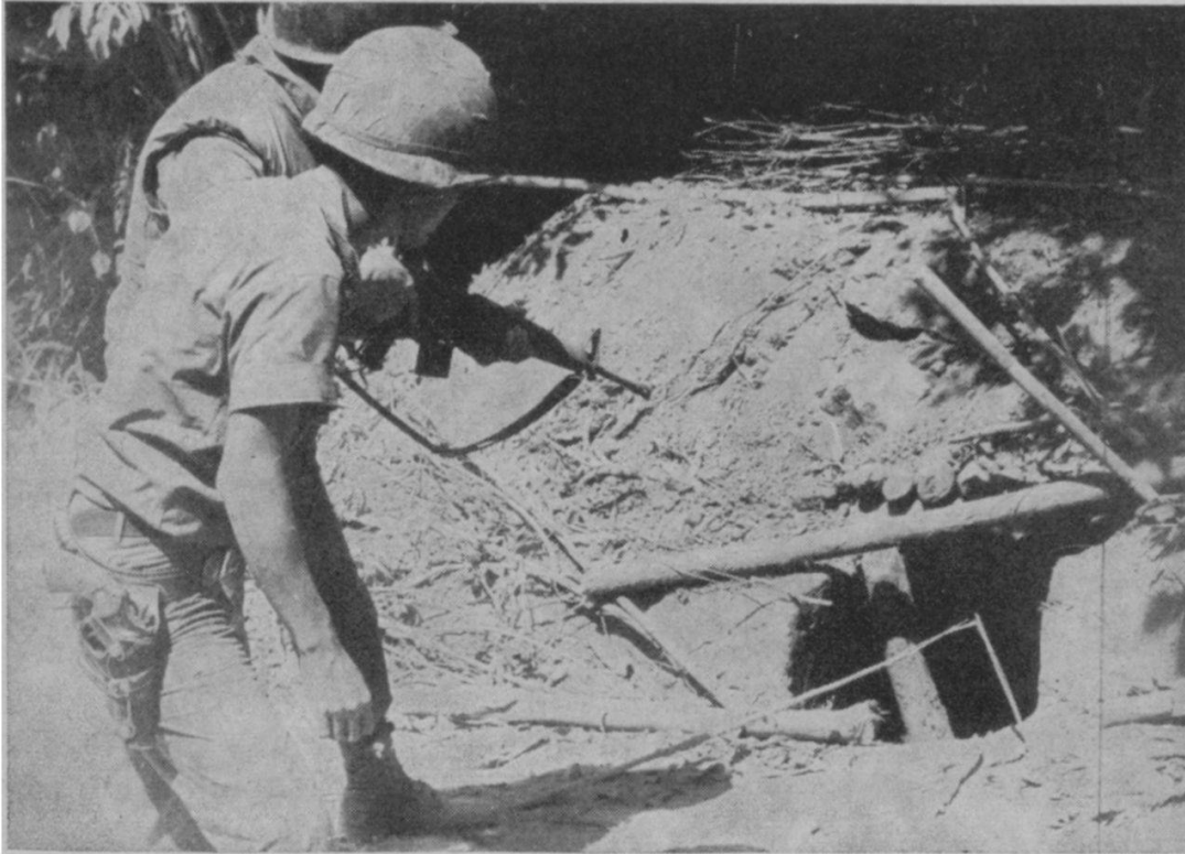
Une des caches (soigneusement dissimulée) d'armes des Nord-Vietnamiens sur la route d'invasion baptisée Ho-Chi-Minh, découverte lors de l'opération Lam Son 719 en mars 1971. (Remarquez le fusil M 16 d'origine américaine tenu par un soldat sud-vietnamien.)

se sont cependant tellement améliorées, qu'ils ne peuvent plus espérer aucun retournement en leur faveur. La population fournit des renseignements de plus en plus nombreux aux forces gouvernementales qui agissent maintenant à chaque fois à coup sûr. La démoralisation fait