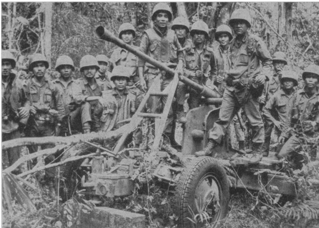
Un lieutenant-colonel sud-vietnamien avec ses hommes entourant une pièce de l'armée nord-vietnamienne, lors de l'opération Lam Son 719.

mienne à l'actuelle opération Lam Son 810 démontre aussi que les troupes de Hanoï ne veulent pas et ne peuvent pas lancer d'offensive importante au Vietnam du Sud même, dûment touchées qu'elles ont été par l'offensive sud-vietnamienne de février et mars. Certes après être