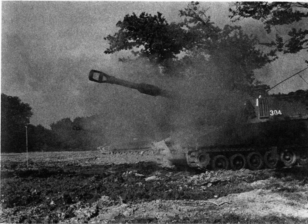
L'obusier blindé M 109 (calibre 15,5 cm).

tirent par pièce individuelle après de nombreux exercices de prise de position.