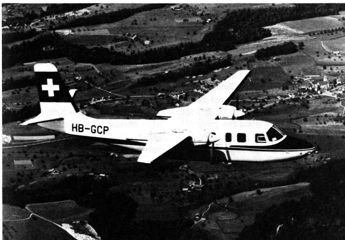
L'avion de mensuration «Grand Commander» HB-GCP.

propriétés foncières, le tracé précis ensuite des itinéraires du commerce, des armées et des pèlerinages, trois vocations précédant les tourisms automobiles et pédestres de notre civilisation de loisirs.