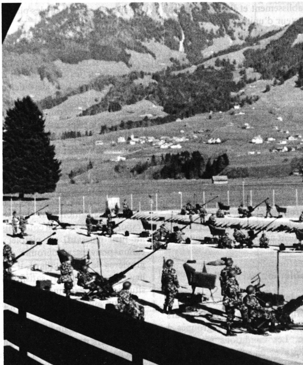
Figure 2. – Exercice de pointage avec l'installation Florett sur la place de tir de Grandvillard.

troisième semaine de service en campagne, sur le modèle de la deuxième, combinée avec l'exercice de survie ordonné par le chef de l'instruction de l'armée. A part les restrictions imposées dans le domaine de la nourriture et du logement, la nouveauté principale sera pour la troupe la marche de 50 km qui permettra de regagner