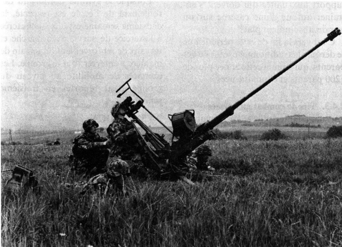
Figure 1. – Can DCA 20 mm 54.

D'autre part, c'est l'occasion de mesurer le travail accompli pendant l'école de sous-officiers tant il est vrai qu'à cette occasion les recrues sont le miroir du caporal, les erreurs ou imprécisions de l'un se reportant sur les autres.