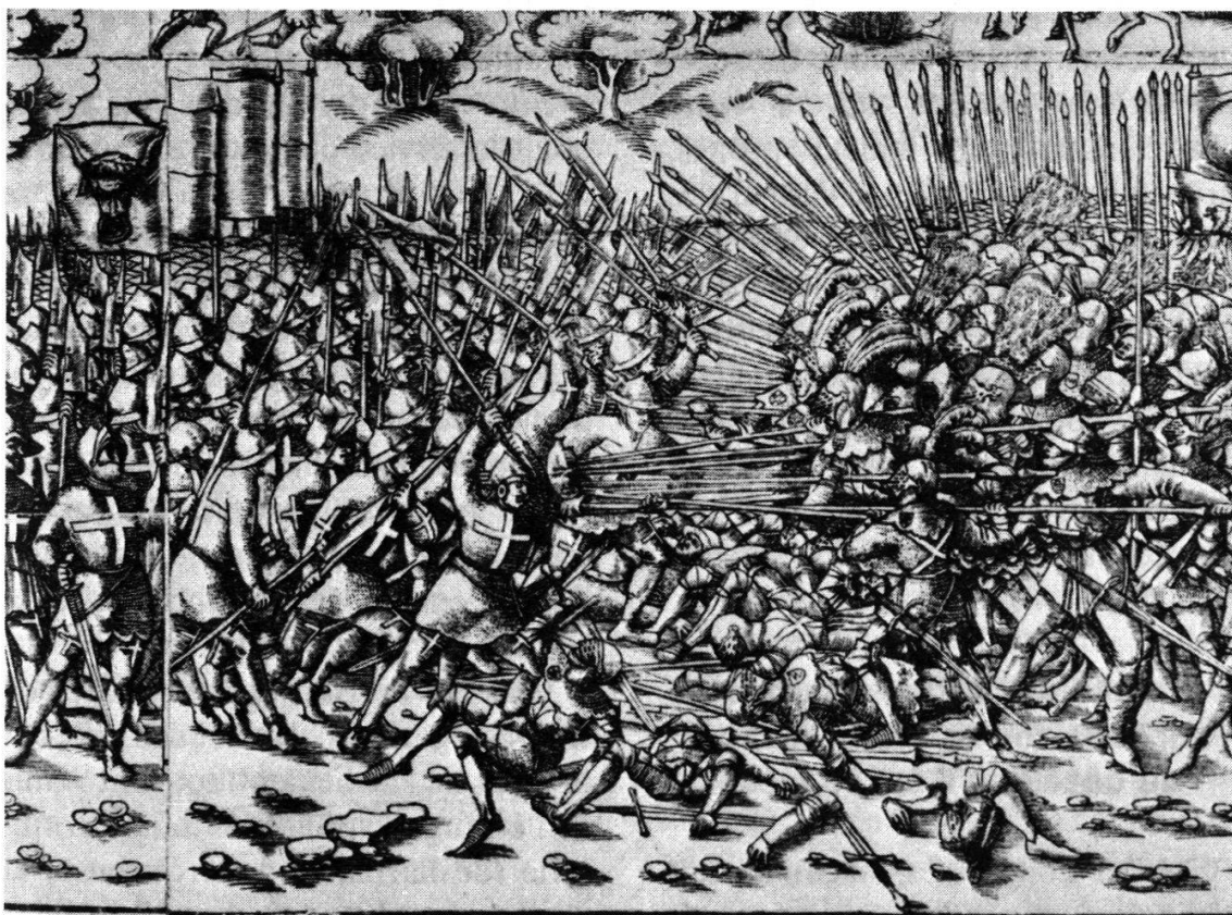
La bataille de Sempach, telle qu'on se la figurait en 1551

L'effectif des armées médiévales ne doit pas être surestimé : il était limité par des servitudes financières, logisti-