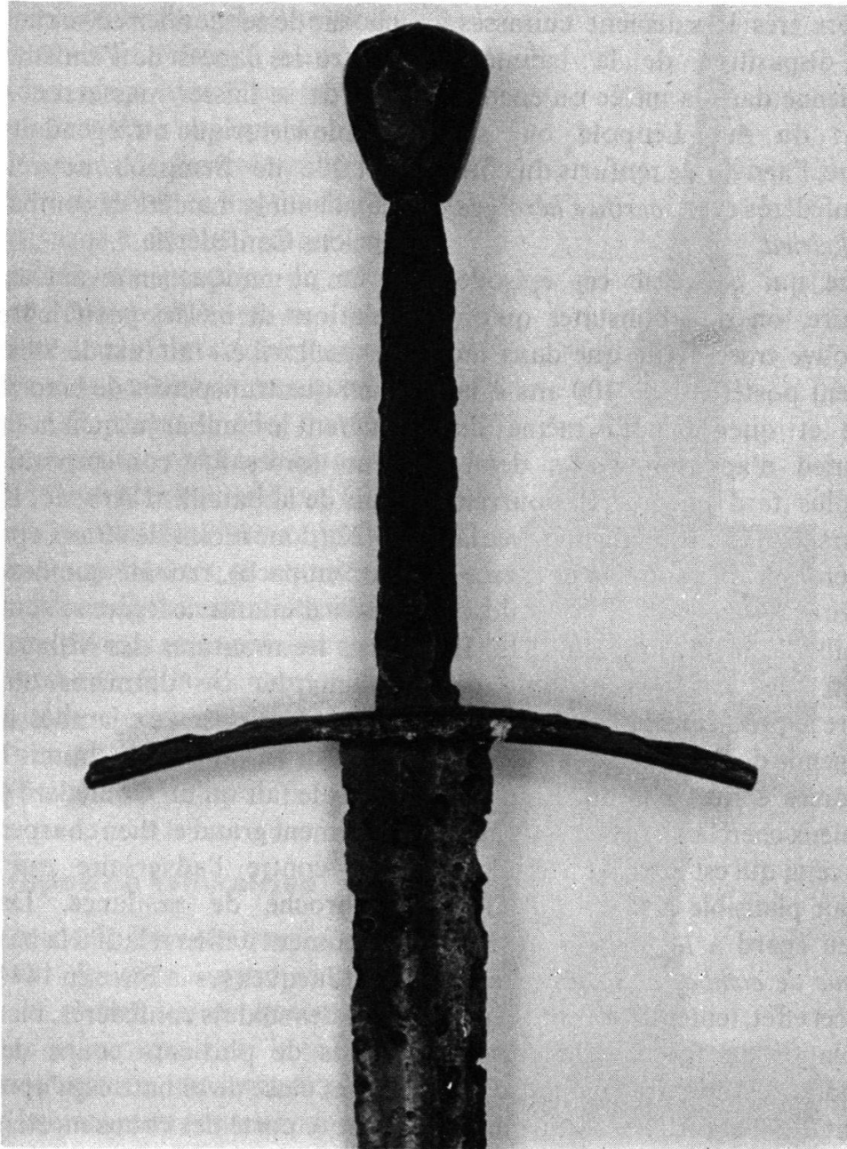
Poignée de l'épée de Friedrich von Tarant, tombé à Sempach