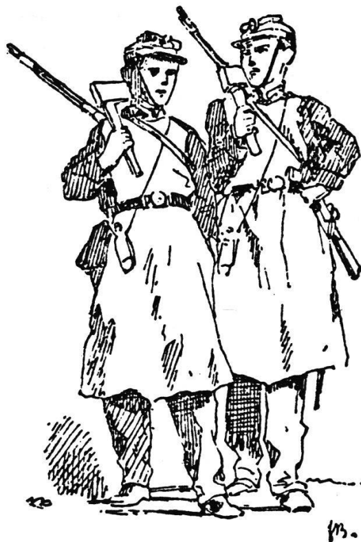
Les sapeurs de Vevey

appel très patriotique 6 . En 1860, il enseigne la gymnastique aux recrues de l'artillerie, à Aarau; l'année suivante, il obtient un subside fédéral pour un séjour d'étude en Prusse, puis il publie, en 1862, un «Manuel de gymnastique» pour les troupes fédérales 7 . Enfin, la Société militaire fédérale, réunie à Lugano en 1861, discute «De la fusion de l'instruction