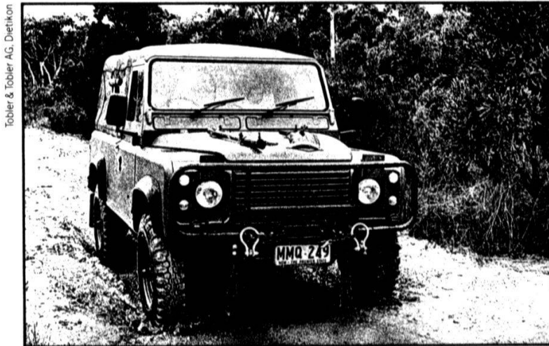
Tobler & Tobler AG, Dietikon