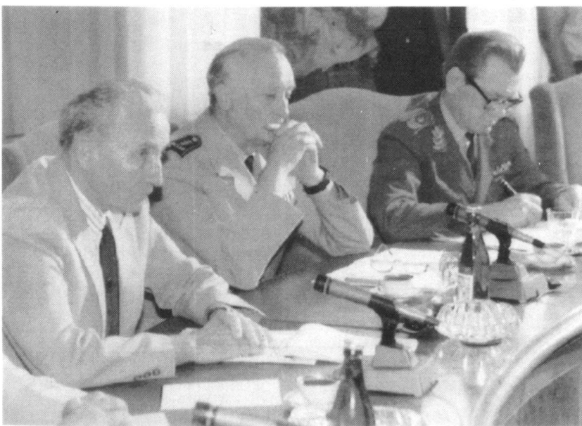
La dissolution du pouvoir fédéral en Yougoslavie et la guerre civile marquent de leur empreinte le projet de réforme de l'armée fédérale autrichienne.

Avec la réforme de l'armée, l'importance quantitative des forces armées, de même que la milice sera réduite; en revanche, le système ne sera pas modifié, mais amélioré au point de vue qualité. Cela touche la possibilité d'engager d'une manière flexible des «forces de présence», mais aussi la possibilité d'amener rapidement des formations de milice qui auraient la mission de renforcer les troupes déjà sur place à la frontière. Certaines fonctions continueront à être exercées par des cadres professionnels. Ceci améliorera la qualité des préparatifs d'engagement et l'instruction sous la forme d'exercices de cadres.