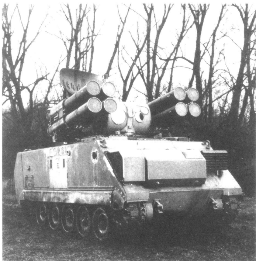
Dans son projet de réforme de l'armée fédérale, le Gouvernement ne semble pas prévoir une modernisation de son aviation et de sa défense aérienne. Sur cette photo, le système «Adats» d'Oerlikon-Bührle.

La réforme de l'armée, on peut la résumer :