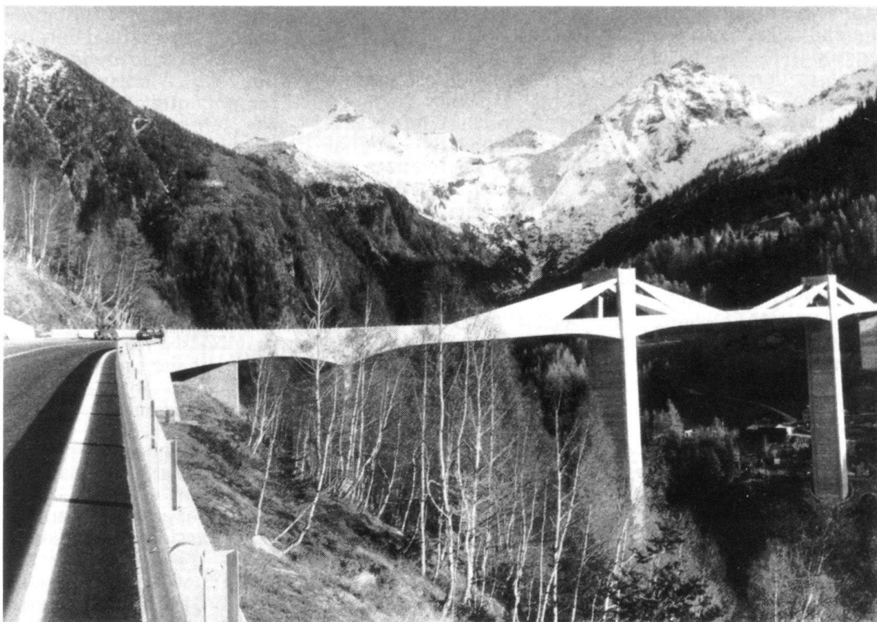
L'audacieux pont de la Ganter, sur la route du Simplon.

Dès lors, pour relever les défis à venir, ce n'est certainement pas un luxe de disposer en suffisance de troupes de montagne bien entraînées, bien équipées et bien conduites pour, s'il le fallait, défendre les transversales alpines et ainsi faire face au probable et à l'imprévisible.