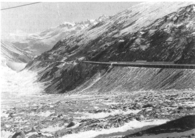
Les ouvrages d'art qui permettent le passage d'un trafic toujours plus dense et plus lourd confèrent une valeur supplémentaire aux cols alpins, souvent doublés d'un tunnel. Ici, celui du Grand-Saint-Bernard.

- la Suisse doit faire face au développement des