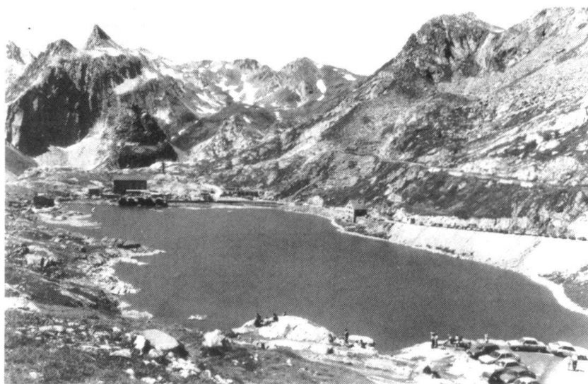
Le col du Grand-Saint-Bernard: Napoléon le franchit le 20 mai 1800 avec son armée.

Cette idée stratégique a été réalisée en plusieurs phases et a été complète au printemps 1941. Dès lors, l'ensemble de l'armée de campagne, soit toutes les divisions et les brigades de