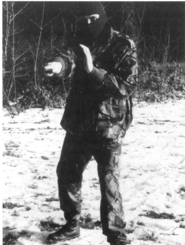
Le coup de pointe.

Si l'on veut obtenir des résultats probants, le «close-combat» doit faire l'objet