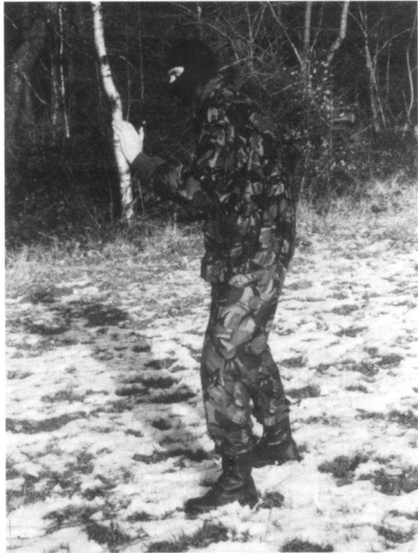
... et de profil.