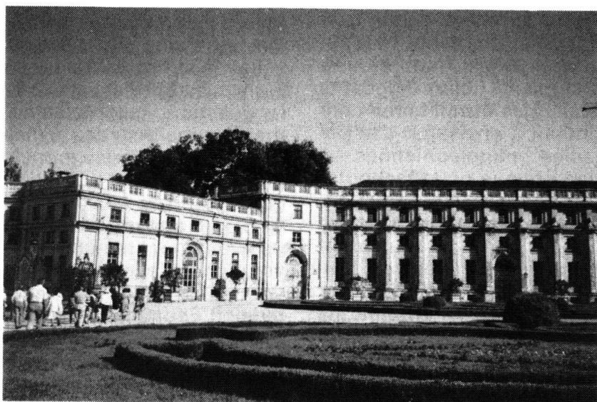
Pavillon de chasse de Stupinigi construit entre 1729 et 1733.

Dans leurs appréciations d'avant la Première Guerre mondiale, les militaires tiennent compte uniquement de l'armée permanente des Etats-Unis dont la faiblesse des effectifs les amène à l'assimiler aux forces danoises, hollandaises et