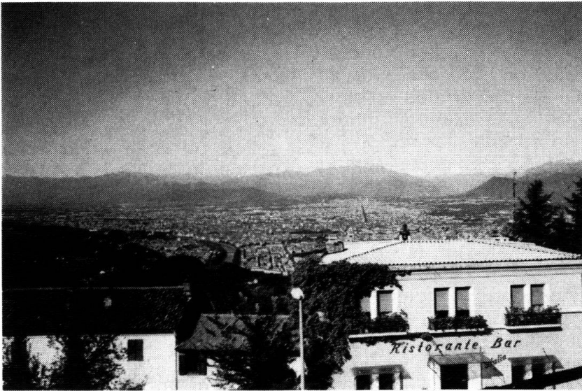
La ville de Turin vue des collines environnantes.

La réalité apparaît beaucoup plus complexe et nuancée. A l'époque des Grandes découvertes, sans que les intéressés ne s'en rendent compte se déroule une sorte de « guerre bactériologique », les Européens infectent les Amériques avec la scarlatine et la variole, tandis qu'ils ramènent sur le vieux continent une maladie jusque-là inconnue, la syphilis. Ce fait prend vraiment une valeur de symbole !