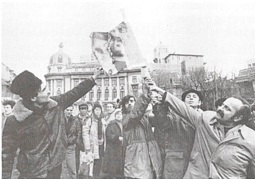
Y a-t-il eu «révolution» en Roumanie?

tions de proches favorables au coup d'Etat, le «Conducator» prend la parole à Bucarest. La foule, rassemblée selon des schémas éprouvés depuis longtemps, reste passive. Comme à l'accoutumé, des haut-parleurs diffusent des ovations pré-enregistrées; il en sort tout à coup des crépitements d'armes et des bruits de foule en détresse. Les personnes présentes s'enfuient, sans siffler l'orateur. Il s'agit d'une opération de la Securitate; fort à propos, des jeunes gens bien drillés prennent la relève avec des pancartes hostiles à Ceaucescu.