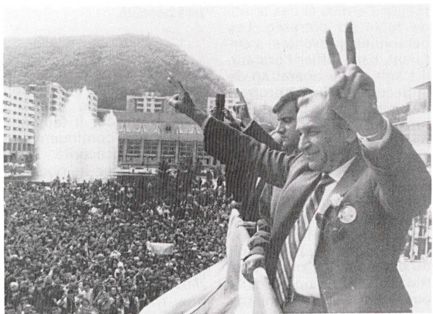
Le président Ion Iliescu a reçu près de 86% des suffrages aux dernières élections en Roumanie.

Le 21 décembre, vraisemblablement sur les injonc-