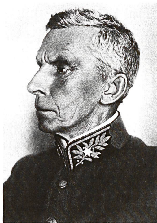
↑ Theophil Sprecher von Bernegg.