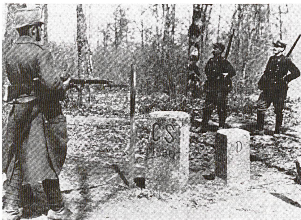
← La « borne des trois puissances » près de Bonfol en Ajoie. Ici se touchent les territoires français, allemands et suisses...