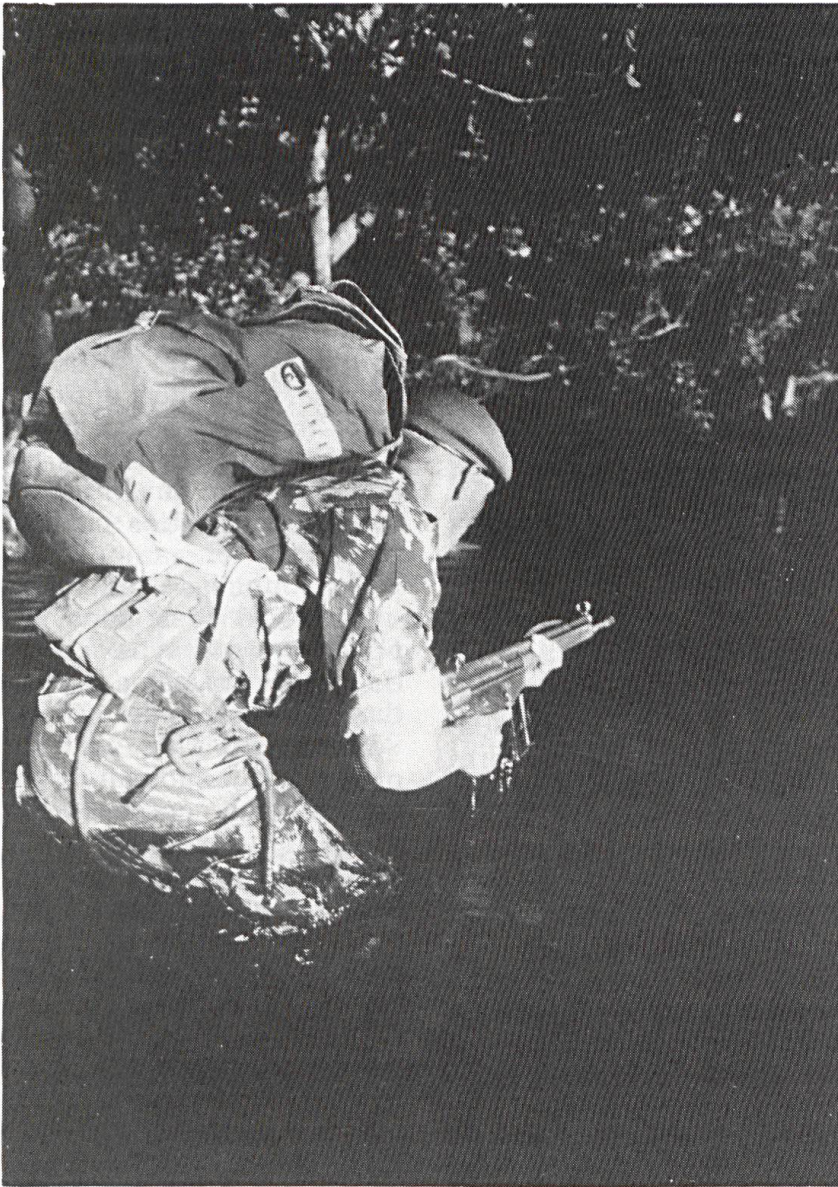
La formation inclut une phase typiquement commando.

tection de son propre territoire; pour ce faire, l'armée portugaise n'a pas hésité à recourir aux techniques les plus modernes de la guerre non conventionnelle et de la guérilla.