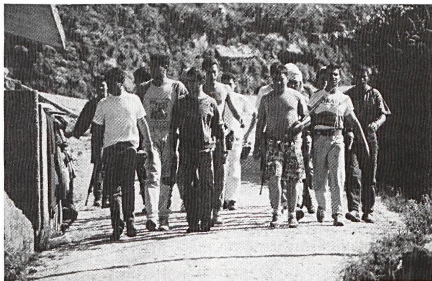
La guerre non conventionnelle ne s'apprend pas de façon conventionnelle.

Dans le petit village de Antès de Mazès, nous