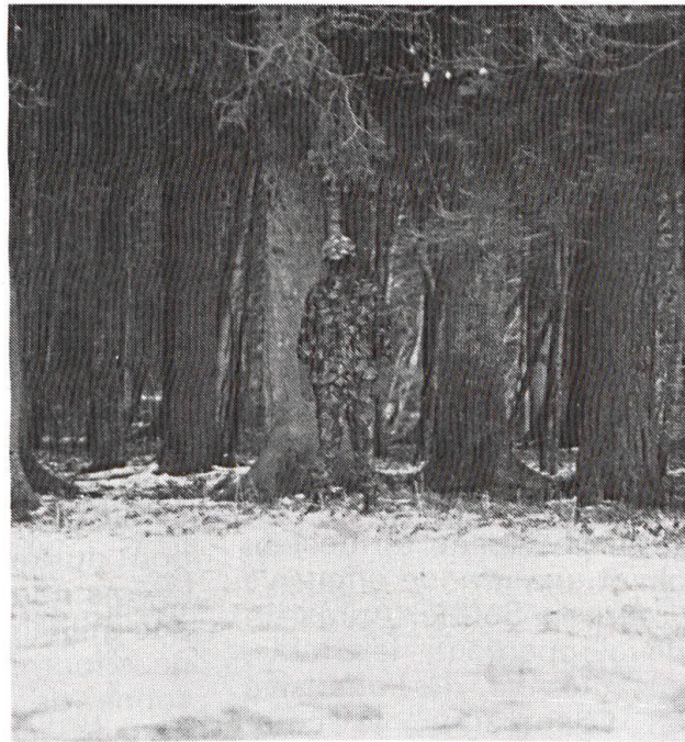
Casqué, le visage recouvert d'une cagoule noire, ce soldat est difficilement visible, à 50 mètres déjà.