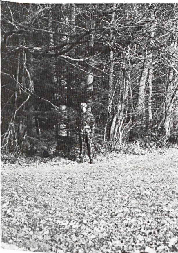
Longeant la lisière, ce soldat est, à distance égale, moins visible. Il se trahit en revanche par la tache claire de son visage.