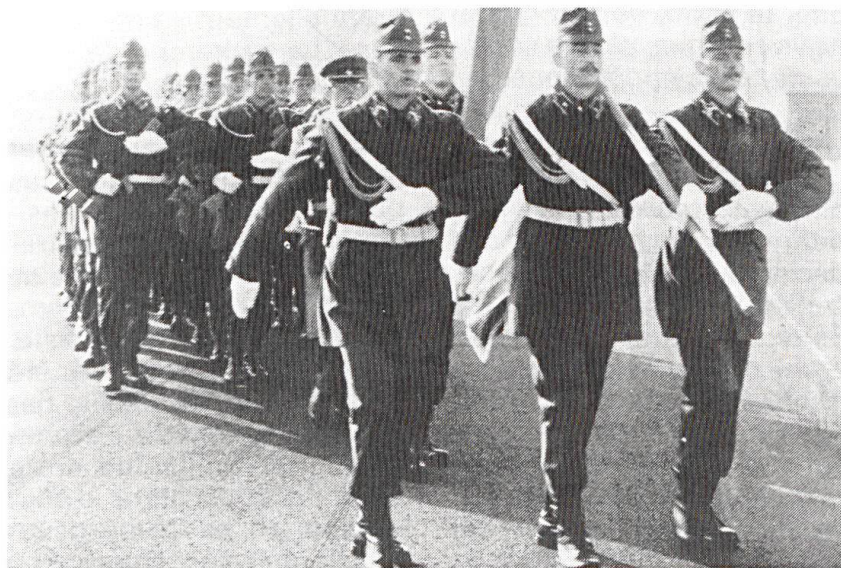
L'armée hongroise, a abandonné le pas de l'oie et les hommes apprennent un nouveau pas de parade.