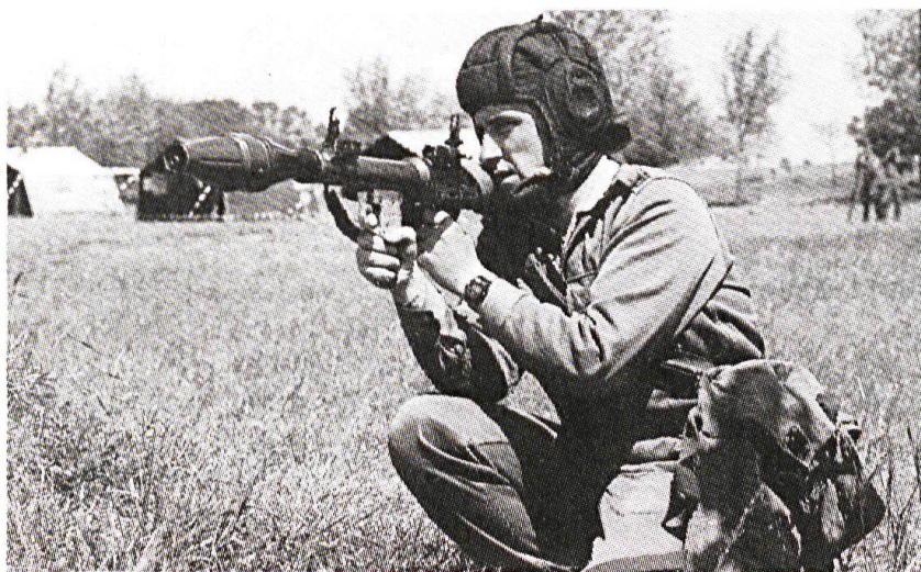
L'arme antichar RPG7. La dotation en munitions d'entraînement serait de six roquettes par tireur.

Il est aussi prévu de mettre sur pied une unité de maintien de la paix, ce projet pouvant être réalisé vers le milieu de l'année 1993.