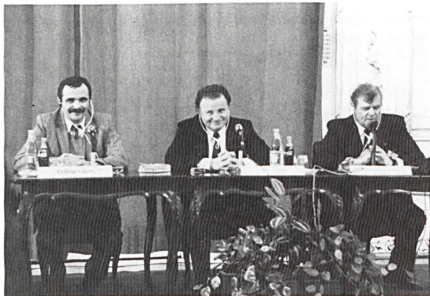
Le ministre hongrois de la Défense, Lajos Für, pendant son exposé.

- La réduction des effectifs, de l'ordre de 30 à 35%, soit de 150 000 à 100 000