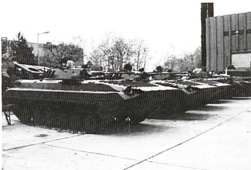
Chars de grenadier BMP-1 devant une halle à Gödölö.

– Un rajeunissement radical des cadres, les postes les plus élevés étant occu-