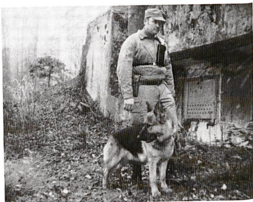
Garde-fortifications en tournée d'inspection.

Composées essentiellement d'infanterie de landwehr et de landsturm, ces brigades sont des formations de barrage qui s'appuient sur le terrain coupé des secteurs frontières de notre pays et de leurs renforcements (barricades, fortins et destructions préparées) entretenus par le corps des gardes-fortifica-