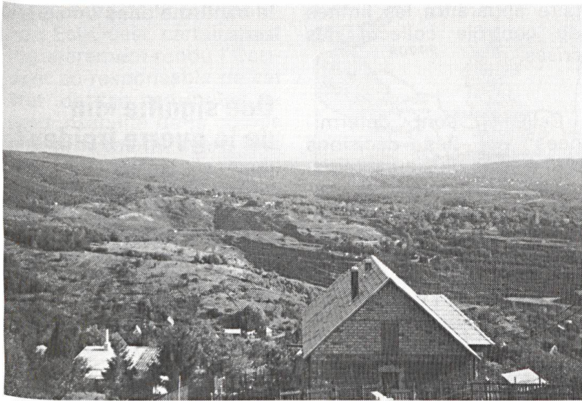
Réhabilitation d'une mine de charbon à ciel ouvert à Pecs en Hongrie. Avant le changement de régime, une mine d'uranium était aussi exploitée dans la région.

té aucune, dès le milieu des années 1970. Moscou détenait, depuis plus d'une décennie, le quasi monopole d'un tel système d'arme.