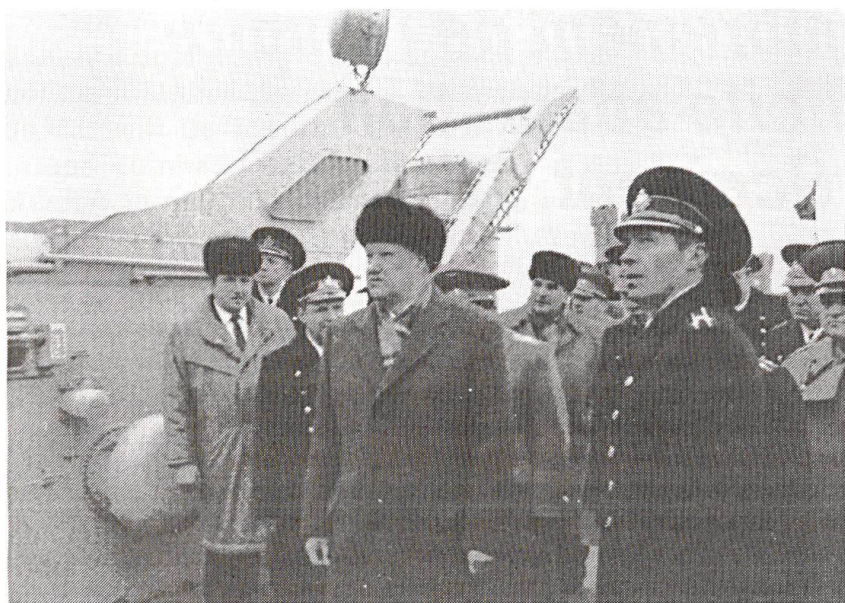
Malgré tous les problèmes que connaît la Russie de Boris Eltsine, la Fédération dispose encore d'un énorme potentiel militaire.

celle de la Communauté européenne en particulier, méconnaissait et sous-estimait la volonté de nations slaves et de cultures diverses d'obtenir par tous les moyens leur reconnaissance et leur indépendance.