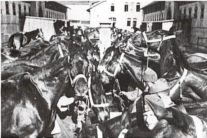
Aarau. Un escadron à l'abreuvoir.

pied à terre». La cavalerie n'était plus nécessaire; elle n'était même plus guère viable. Il serait pourtant injuste qu'on ne garde d'elle qu'un souvenir folklorique. Pendant des siècles, elle a été l'Arme de la décision; l'esprit cavalier, fait de hardiesse et de vues lointaines, a inspiré de grands capitaines. La nostalgie des anciens est donc justifiée, car elle ne se nourrit pas seulement du charme qu'il y avait à servir à cheval. Aujourd'hui il importe qu'ils aident leurs après-venants, qui «montent» des chars, à ressentir le même feu sacré.