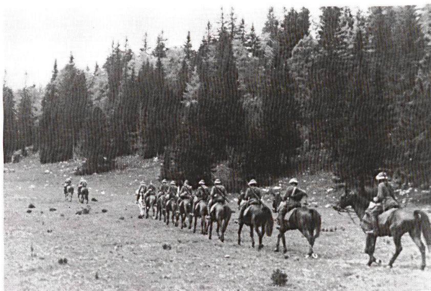
Au temps du mousqueton. 1951.

L'agriculture s'est motorisée; les paysans n'ont pas fait de sentiment pour renoncer à la traction anima-