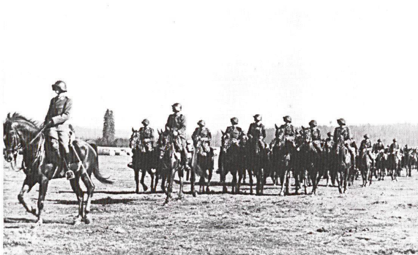
1962, Les Breuleux. Un des derniers défilés «à l'ancienne»: officiers sabre au clair, escouades sur un rang (derrière leur brigadier), se suivant à 10 mètres l'une et l'autre. Fusil d'assaut à la selle.

les suivre à la trace. Or, on sait bien que, dans notre pays où les chevaux sont devenus rares, une colonne de 40 montures laisse des traces révélatrices: empreintes de fers (même sur le béton) et crottins frais! D'ailleurs de si nombreux chemins de forêt ont été «durcis» pour faciliter le trafic des tracteurs, qu'on n'y peut plus galoper sans mal pour les sabots des chevaux.