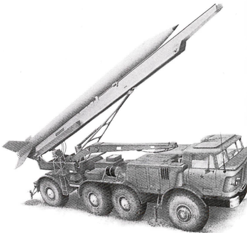
Depuis 1956, l'Armée rouge a mis en œuvre des milliers de fusées Frog, déployées face aux armées de l'OTAN. Sans système de guidage, le Frog n'est en fait qu'une roquette de grande dimension dont le manque de précision est compensé par la puissance de la charge.

On n'arrive pas actuellement à repérer avec certitude un missile bien camouflé, mais il est pratiquement impossible de cacher un objet d'environ 10 m, quand il est dressé. Quoi qu'il en soit, le site est re-