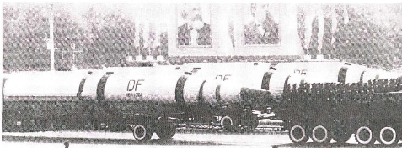
Trente de ces missiles chinois CSS-2 ont été vendus à l'Arabie Saoudite...

dissuasion crédible, efficace et peu coûteuse.