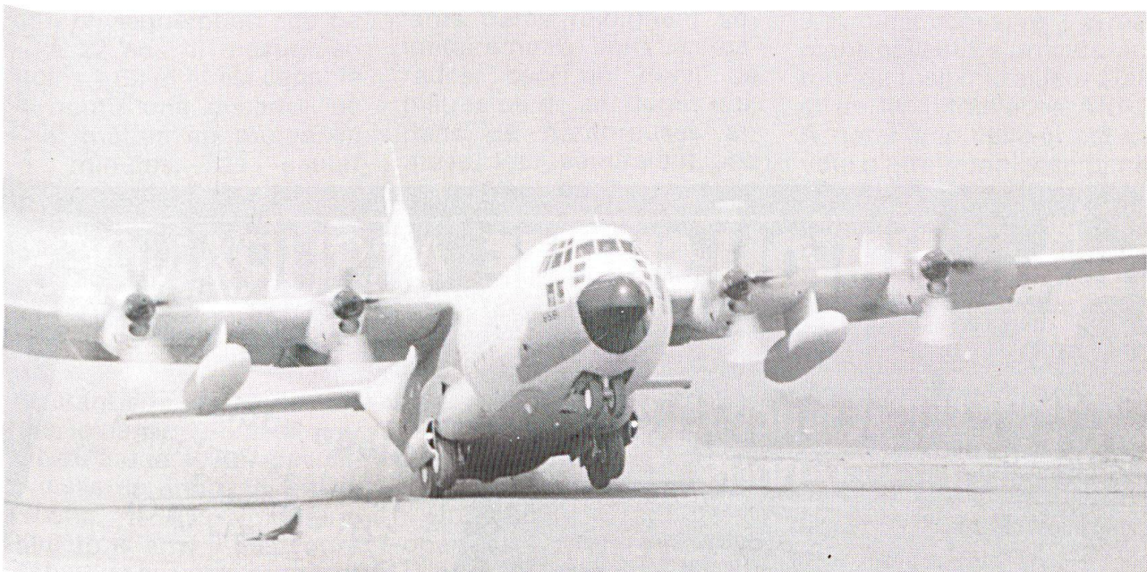
Un C-130 Hercules au décollage (charge maximale emportée, 20 tonnes).

En réalité, nous avons affaire, avec le dernier plan, à des réductions dont les raisons sont budgétaire, intégrant en partie seulement