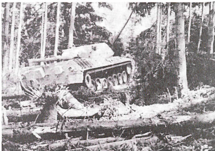
Char de combat Leopard-1 en terrain difficile.

Ces réactions des responsables de l'OTAN apparaissent très intéressantes à l'observateur suisse. Contrairement à ce que certains prétendent chez nous, la participation de la Suisse à une défense commune en Europe (OTAN ou UEO) ne signifie pas forcément une diminution des crédits d'armement ou la possibilité d'entretenir des forces équipées de matériels désuets. L'effort doit être partagé équitablement entre tous les Etats membres... (RMS)