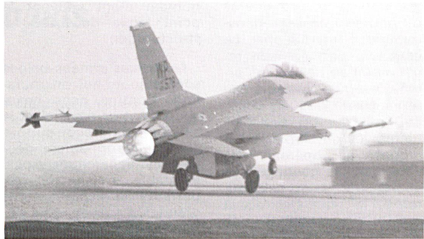
Un F-16, postcombustion allumée, décolle.

En Belgique, nous avons connu ces dernières années trois plans successifs. L'étude Gysemberg et le plan Charlier 1 étaient des plans d'attente prudents où