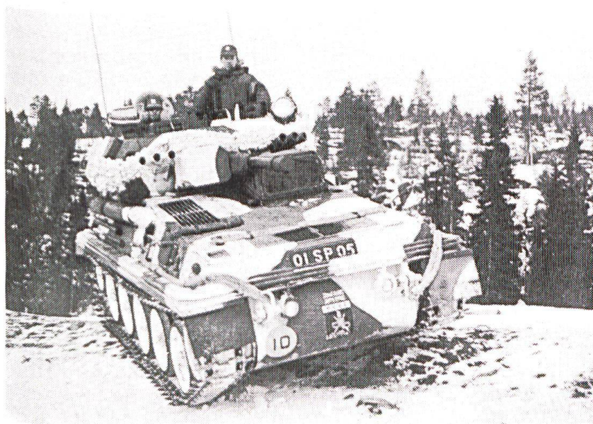
Char d'exploration Scorpion.

Ainsi, le budget plafond passe finalement à 88 milliards de francs belges (soit un milliard de moins que le montant fixé en juillet dernier), (...) la réserve en effectifs sera constituée au maximum de 30 000 hommes, alimentée par des militaires à statut court terme, des volontaires civils (service civique à créer) et des militaires de carrière retraités sur base volontaire.